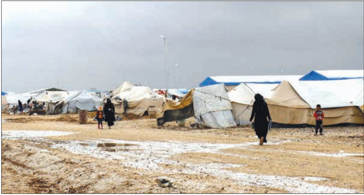
منظر عام لاجد الخيمات بالقرب من بلدة العريشة في محافظة الحسكة الشمالية الشرقية

وأوضح أن الهجوم الذي تخللته اشتباكات أسفر عن مقتل تسعة عناصر من قوات النظام والمسلحين الموالين لها فضلا عن خمسة مقاتلين من المجموعات المسلحة، وعلى رأسها تنظيم حراس الدين المرتبط بتنظيم القاعدة والذي كان أعلن سابقاً رفضه للاتفاق الروسي - التركي.