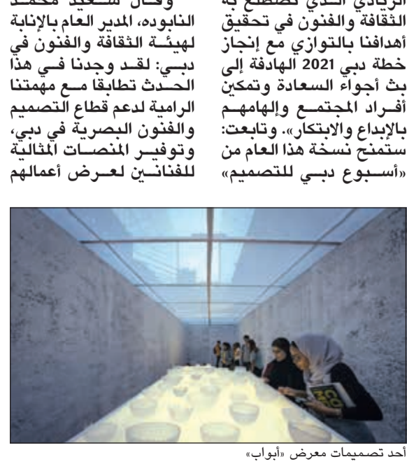
أحد تصميمات معرض «أبواب»

تتعقد الدورة الرابعة من فعاليات أسبوع دبي للتصميم بالتعاون مع حي دبي للتصميم d3 وبدعم من هيئة دبي للثقافة والفنون» و«أودي الشرق الأوسط»، لتقدم أكبر دورة شاملة في تاريخها. وتتضمن الفعالية 250 نشاطا من قبل أكثر من 120 شركة، كما يشمل المهرجان على معارض ومشاريع لجسمات مصممة خصيصا للاحتفال بهذه المناسبة، إضافة إلى العديد من الجوائز والمناسبات والجلسات الحوارية وورش العمل والجولات والتجارب الفريدة لعشاق التصميم وعامة الزوار على حد سواء. ويعزز أسبوع دبي للتصميم خلال دورته الرابعة مكانته كعامل محفز ساهم في رسم ملامح دبي لتكون عاصمة إبداعية على مستوى المنطقة. فعلى مر السنين تكثفت الفعالية من منح شريحة واسعة من المصممين في المنطقة والعالم منصة دولية لعرض إبداعاتهم. ومع باقة الفعاليات الطموحة التي تم إدراجها في جدول الأعمال، يعكس أسبوع دبي للتصميم هوية المدينة العريقة من خلال تأسيسه لمنصة تجمع تحت مظلتها أبرز المواهب الإبداعية وتستكشف أبعادا تتجاوز حدود المتوقع وتحتضن طيفاً من التوازن الكامنة في الشغف والابتكار الذي يدفع المدينة نحو مزيد من التقدم والازدهار.