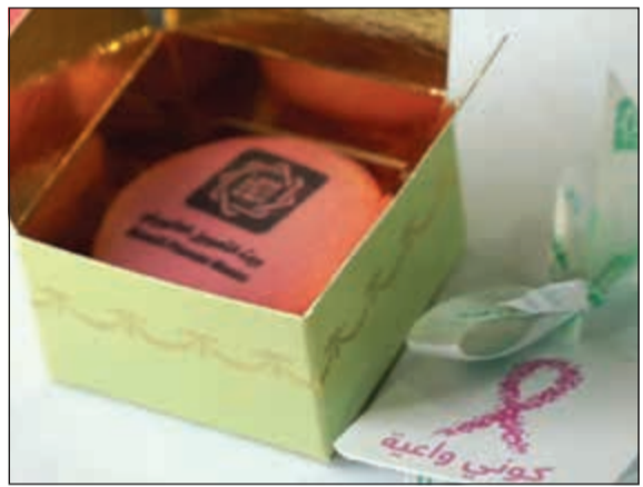
الشهر العالمي لسرطان الثدي Breast Cancer Awareness Month

الخصومات المتميزة، ومنها خصم 50٪ لجميع عميلات البنك على فحص الماموغرام الأكثر فاعلية للكشف المبكر عن سرطان الثدي. واستمر العرض طيلة شهر أكتوبر بالتعاون مع مستشفى السلام الدولي. كما قدم «بيتك» عرضا خاصا لجميع عميلاته في «بك يو» - مجمع الأفيون، حيث تالت المبادرة استحسانا