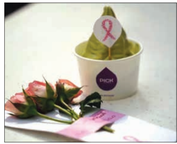
كبيرا من الجمهور والمتابعين على قنوات «بيتك»، على وسائل التواصل الاجتماعي، ونمّنوا دور «بيتك» في المسؤولية الاجتماعية والاهتمام بمختلف شرائح العمال، وكذلك التفاعل مع كل المناسبات العلمية والتميز في إنجاز برامج وحملات توعوية بفاعلية وكفاءة عالية، تركت أثرا إيجابيا في المجتمع.

ويحرص «بيتك» على المشاركة السنوية في الشهر العالمي للتوعية بسرطان الثدي، ما يؤكد دوره البارز والرائد في خدمة المجتمع والالتزام بالمشاركة في المبادرات الصحية ضمن إطار المسؤولية الاجتماعية. ويتميز «بيتك» بسجل حافل في مجال دعم القطاع الصحي، حيث ساهم البنك في دعم ورعاية العديد من المشاريع والمبادرات في المجال الصحي، وأهمها توقيع اتفاقية لمكافحة أمراض السكري، وكان المساهم الأكبر بين الشركات الكويتية في المشاركة بفعاليات اليوم العالمي لمرضى السكري، وذلك بأنشطة متنوعة بالتعاون مع وحدة السكر بالمستشفى الأميري ومركز دسمان للسكري، بالإضافة إلى تنظيم سلسلة دورات في الإسعافات الأولية والتبرع بالدم ورعاية العديد من الندوات والحملات التوعوية عالية، تركت أثرا إيجابيا في المجتمع.