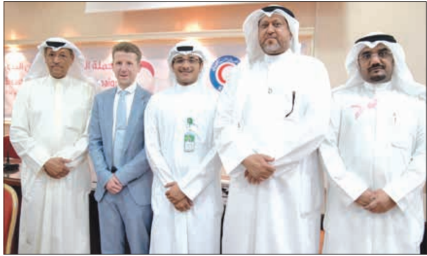
ممثل «بيتك» خلال الحملة

ويحرص «بيتك» على المشاركة السنوية في الشهر العالمي للتوعية بسرطان الثدي، ما يؤكد دوره البارز والرائد في خدمة المجتمع والالتزام بالمشاركة في المبادرات الصحية ضمن إطار المسؤولية الاجتماعية. ويتميز «بيتك» بسجل حافل في مجال دعم القطاع الصحي، حيث ساهم البنك في دعم ورعاية العديد من المشاريع والمبادرات في المجال الصحي، وأهمها توقيع اتفاقية لمكافحة أمراض السكري، وكان المساهم الأكبر بين الشركات الكويتية في المشاركة بفعاليات اليوم العالمي لمرضى السكري، وذلك بأنشطة متنوعة بالتعاون مع وحدة السكر بالمستشفى الأميري ومركز دسمان للسكري، بالإضافة إلى تنظيم سلسلة دورات في الإسعافات الأولية والتبرع بالدم ورعاية العديد من الندوات والحملات التوعوية عالية، تركت أثرا إيجابيا في المجتمع.