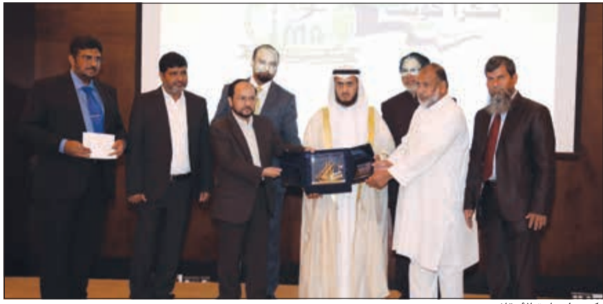
تكريم لوزارة الأوقاف

برعاية وزارة الأوقاف، نظمت جالية «مسلمي الهند في الكويت» حفلا بمناسبة مرور 25 عاما على تأسيسها في الكويت بقاعة الأفرح في فندق كراون بلازا مساء أول من أمس. وخلال الحفل، قال الوكيل المساعد للعلاقات الخارجية والإعلام ندبا في وزارة الأوقاف محمد العليم إن الوزارة وجمعيات النفع العام حريصة كل الحرص على دعمها اللامحدود في دعم هذه الجالية، مؤكدا أن أبونا مفتوحة ونشد على إيديهم في مثل هذه الأنشطة والفعاليات التي يقومون بها. وتابع قائلا إن ما شهدناه اليوم خلال العرض المرئي يتلج الصدر ويسير خاطر، وهذا تحقيا لقول الله جل في علاه: (وتعاونوا على البر والتقوى ولا تعاونوا على الإثم والعدوان) فلا شك أن هذه الجالية وغيرها من الجاليات تعاني من الغربة فتأتي مثل المشتركة لتخفف من وطأة الغربة عليهم من خلال تلك الأنشطة الثقافية والرياضية المجتمعية، وهناك تطور مستجد واحترافية في عمل هذه الجالية. من جانبه، قال مستشار الإدارة العامة الزميل يوسف