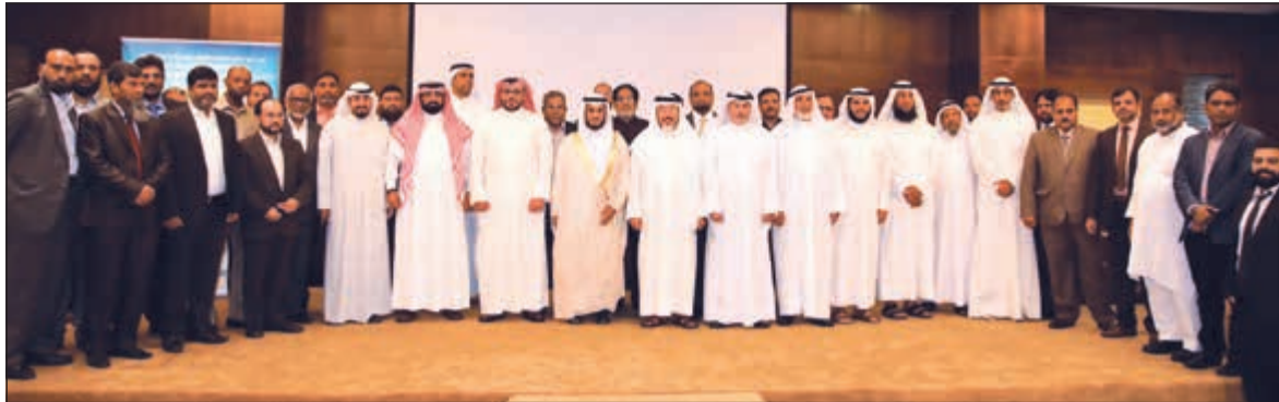
صورة جماعية للمشاركة في احتفال جالية مسلمي الهند

وكذلك الشيخ نادر النوري رحمه الله بالإضافة إلى مبرة أهل الكويت وجمعية الشيخ عبدالله النوري وجمعية التميز الإنساني ومكتب التعاون الإسلامي جمعية الإصلاح الاجتماعي ونماء للزكاة والتنمية المجتمعية ولا ننسى أبداً التفاعل الكبير والدعم اللامتناهي من مسؤولي المسجد الكبير ووزارة الأوقاف. بدوره، قال رئيس قسم الجاليات ورعاية المهتمين وطلبة البعث خالد السنان: «مسلمي الهند في الكويت» بمختلف المجالات المتنوعة سواء الدينية أو الثقافية أو المجتمعية نتمنّى هذه الجهود ونباركها ونُدعمها ونُدعم لها كل الرعاية والعناية والإشراف.