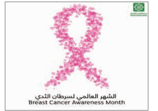
الشهر العالمي لسرطان الثدي Breast Cancer Awareness Month