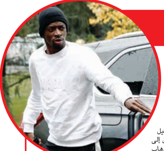
عثمان ديمبلي بحاجة للانضباط مع برشلونة

واستخلصت الصحيفة رسالة النادي لوكيل اللاعب والتي تنص على: «يحتاج عثمان إلى من حوله والذين يحيونه ينصحونه بالذهاب للنوم في ساعة ما وإيقاظه في ساعة مناسبة من أجل التدريبات».