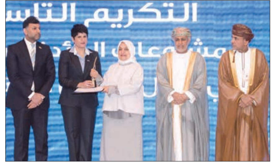
الوزيرة هند الصباح تسلم مثال المطر جائزة المشروع الرائد في العمل الاجتماعي الخليجي لعام 2017. «الوطني»

الاقتصادية والاجتماعية من خلال توفير تكاليف العلاج والسفر إلى الخارج. بدوره، عبر د.حسين عن فخره بما وصل إليه مستشفى بنك الكويت الوطني للأطفال من مستوى متقدم من حيث الخدمات ما يضعه اليوم ليكون في مصاف المؤسسات العالمية المميزة بمعايير الجودة العالمية في مجال الخدمة الطبية، وأعتبر أن الجائزة حافز لمواصلة الاستمرار بتحقيق أفضل الممارسات في إدارة الرعاية الصحية، وذلك من خلال أدوات فعالة أساسها التعاون وجودة الخدمة والتميز في الرعاية والتركيز على الأسرة. كما أشاد د.حسين بما يقدمه بنك الكويت الوطني من دعم ومساندة لعلاج الأبناء والأطفال، مؤكدا أن هذه الجهود والمبادرات والمساعدات قد حققت نتائج إيجابية ليس فقط على صعيد حياة المرضى وإنما أيضا على ذويهم وعلى الفريق العامل في المستشفى على حد سواء.