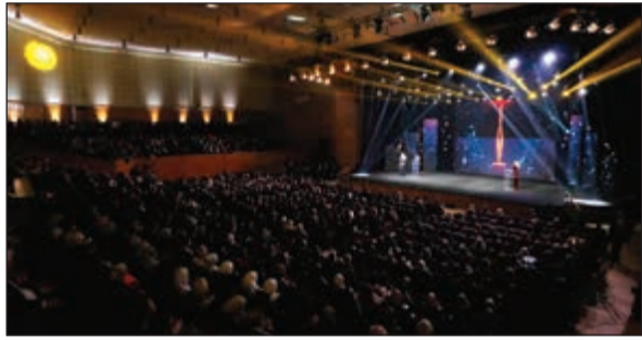
جمع غفير من الحضور في حفل 2017

وتحتفي «تكريم» سنويا بشخصيات ومؤسسات تميزت بإنجازاتها في كل من هذه الخدمات أو الفئات: المبادرون الشباب، التنمية الشخصية المستدامة - المرأة العربية الرائدة، الإبداع في مجال التعليم، الإبداع العلمي والتكنولوجي، الإبداع الثقافي، الخدمات الإنسانية والمدنية، القيادة البارزة للأعمال، المساهمة الدولية في المجتمع العربي. وتطلق «تكريم» للمرة الأولى منتدى بعنوان TAK.MINDS في اليوم الذي يلي الاحتفال بالمبدعين العرب أي بتاريخ 18 نوفمبر في مركز الشيخ جابر الأحمد الثقافي، وذلك بحضور شخصيات عالمية بارزة ساهمت بشكل فعال في مجتمعها وتحدث الظروف وكسرت القيود. فجاء هذا المنتدى لمد جسور بين وجوه عربية متألقة والشباب العربي في ميادين عدة من