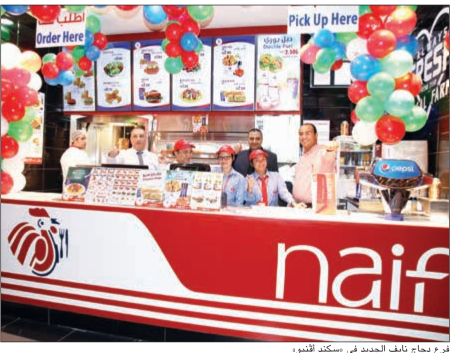
فرع دجاج نايف الجديد في «سكند أقنيو»