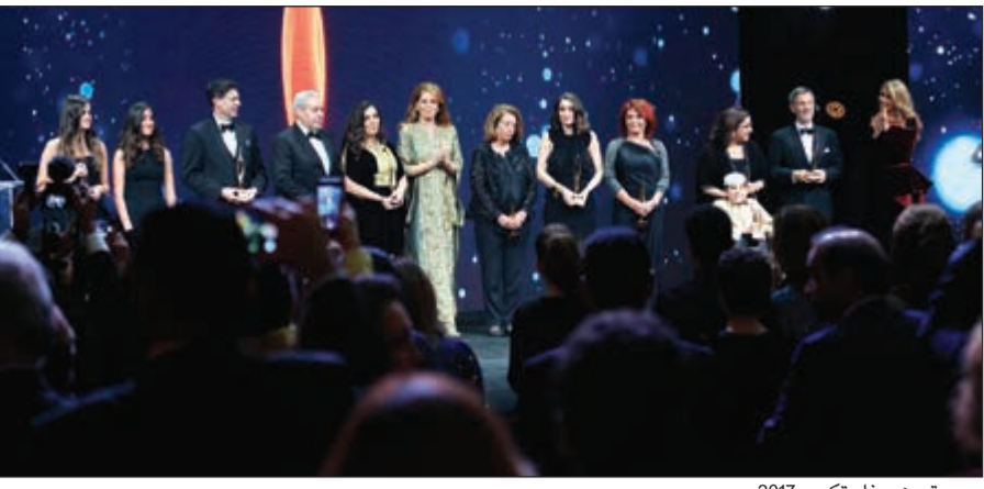
صورة من حفل تكريم 2017