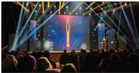
مبادرة «تكريم» للمبدعين المتميزين