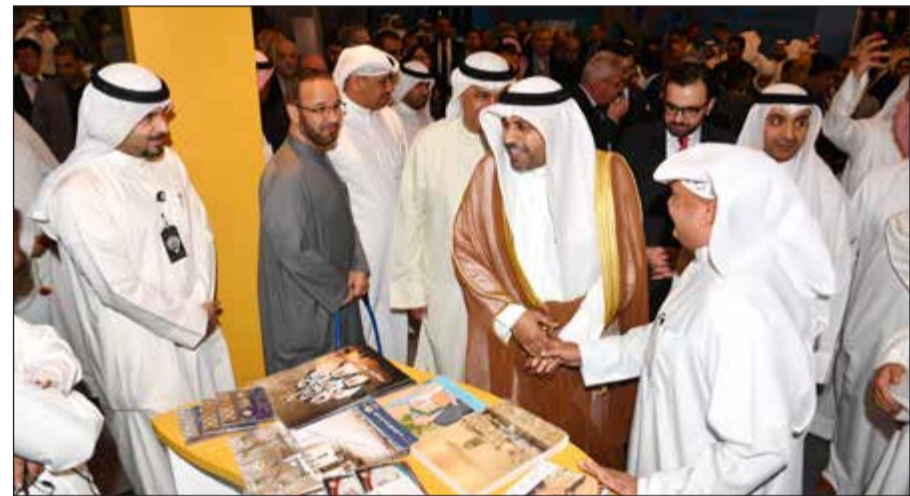
وزير الإعلام وم. علي اليوحة خلال جولة في أروقة معرض الكتاب

واعرب وزير الإعلام عن سعاداته بمشاركة هذا العدد الكبير من المثقفين والابناء ودور النشر والذي يتجاوز عددهم 505 دور نشر و26 دولة مشاركة مما يثري المعرض ويحقق نتائج ثقافية ونجاحا في الاستزادة من المعرفة والثقافة والتقارب فيما بين الشعوب، وحرصا على