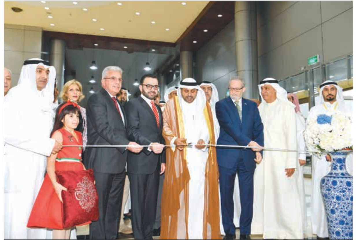
محمد الجبري ود. إيهاب بسيسو والسفير لورانس سيلفرمان والسفير رامي طهبوب وم. علي اليوحة لدى افتتاح معرض الكتاب