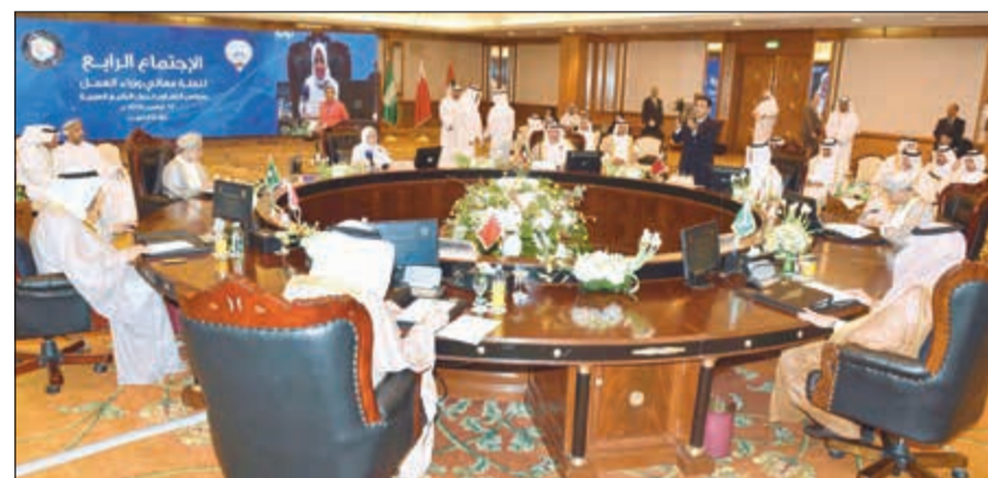
الوزيرة هند الصبيح مع وزراء الشؤون الخليجين

وضمن استراتيجية واضحة ومتناسقة بين مختلف المجالات ذات العلاقة بقطاعي العمل والشؤون الاجتماعية لتحقيق التنمية الاقتصادية التي تصبوا إليها مجتمعاتنا. من جانبه، أثنى الأمين المساعد للشؤون الاقتصادية والاجتماعية في الأمانة العامة لمجلس التعاون خليفة العبري على جهود الكويت استضافة الاجتماع الرابع لوزراء الشؤون والعمل، متقدما بخالص التهاني والتبريكات إلى سلطنة عمان بالعيد الوطني الثامن والأربعين. وقال في كلمته خلال الاجتماع ان الوزراء يتطلعون نحو تحقيق الأهداف والتوجيهات لأصحاب الجلالة والسمو قادة دول المجلس، الرامية إلى توفير أقصى سبل الراحة والطمانينة الاجتماعية لمواطني دول المجلس.