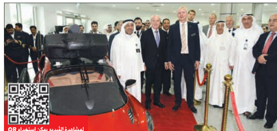
السفير الهولندي فرانس بوتابت ود.عبدالرزاق المحمود وروبرت دينجانسيه والحضور لدى عرض السيارة الطائرة في كلية تكنولوجيا الطيران (احمد علي)