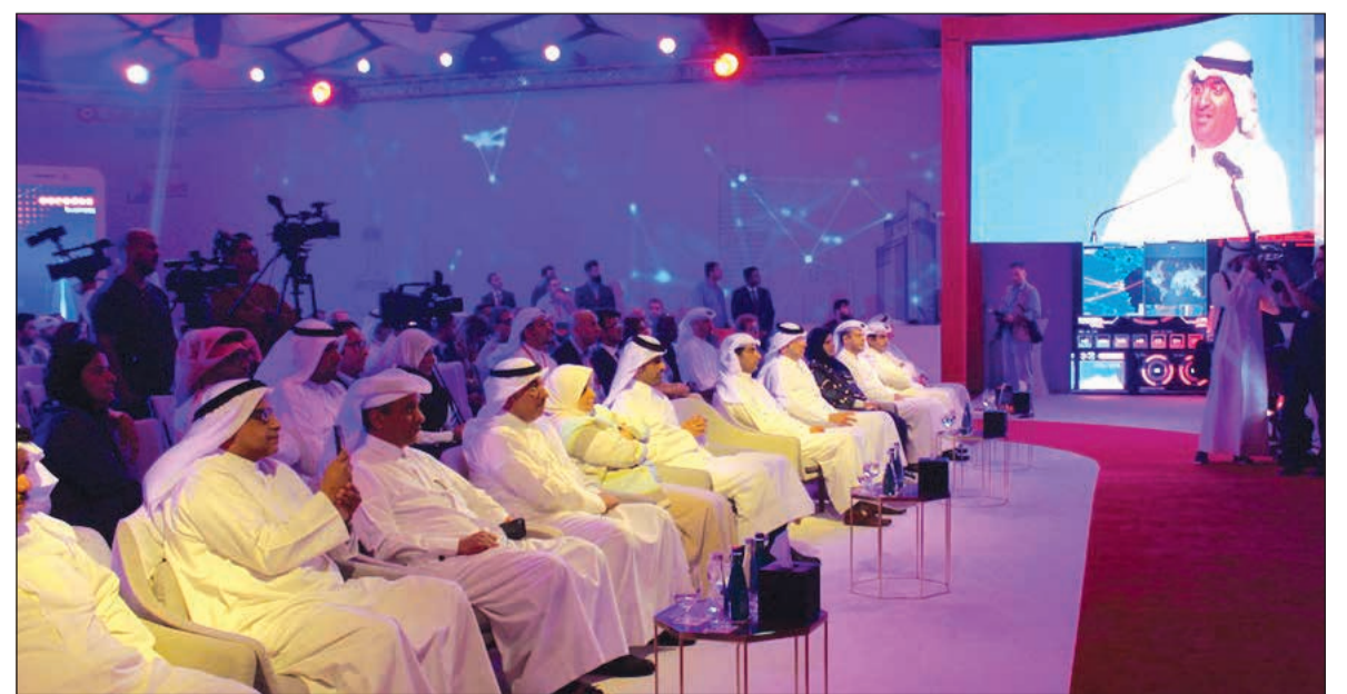
من كلمة الروضان