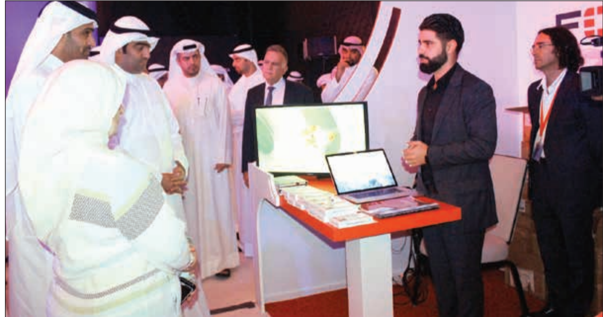
جولة في المعرض