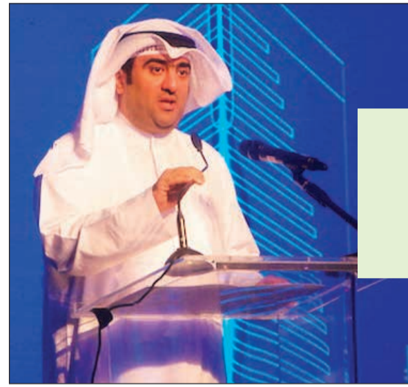
الروضان متحدًا عن الاقتصاد الرقمي

طرح نماذج إلكترونية لتراخيص المحلات التجارية مع بداية العام المقبل