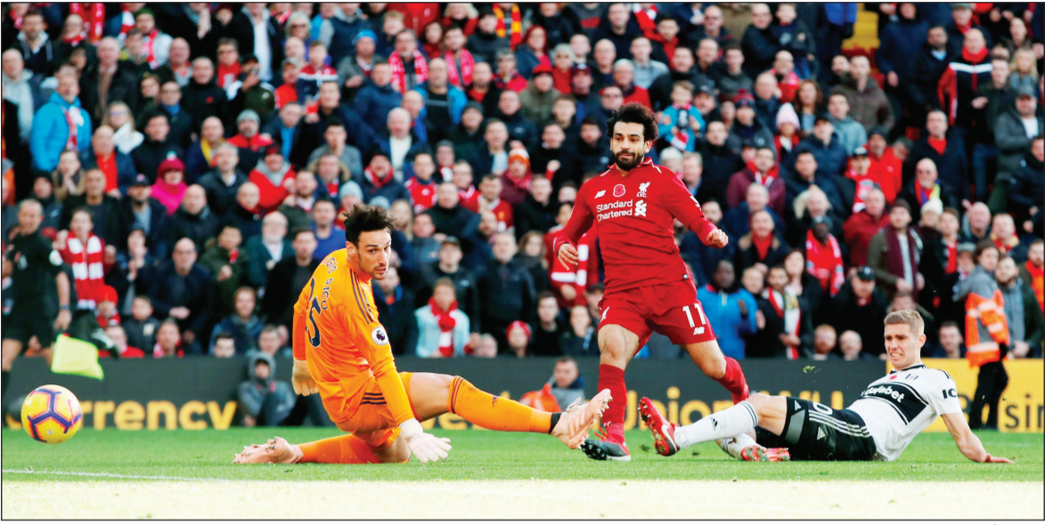
تجم ليقربول محمد صلاح مفتتحا التسجيل لليفربول

حسم مان سيتي ديربي المدينة أمام جاره مان يونايتد، بالفوز عليه 3-1، أمس ضمن منافسات الجولة 12 من الدوري الإنجليزي الممتاز لكرة القدم. وأحرز أهداف مان سيتي كل من دافيد سيلفا (12) وسيرجيو أغويرو (48) والكاي غونديغان (86)، فيما سجل أنتوني ماركس هدف يونايتد الوحيد في الدقيقة 58 من ركلة جزاء. واستعاد مان سيتي الصدارة بعدما رفع رصيده إلى 32 نقطة، متقدماً بفارق نقطتين عن ليقربول الذي فاز في وقت سابق على فولهام 2-0، أما مان يونايتد، فتجمد رصيده عند 20 نقطة في المركز