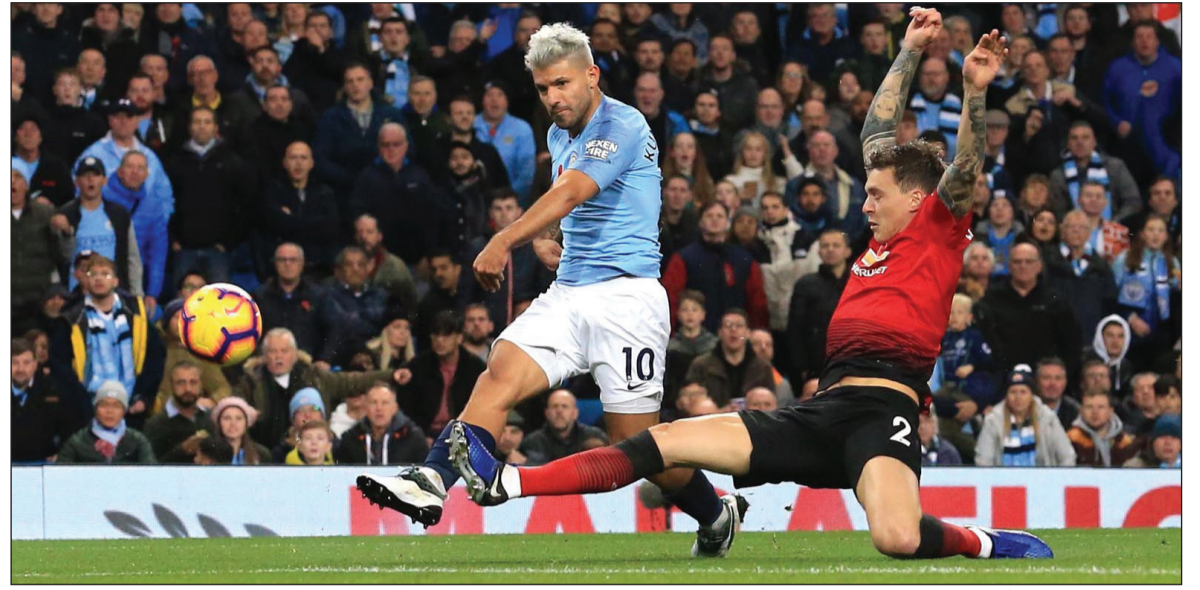
كرة مهاجم مان سيتي أغويرو في طريقها لشباك مان يونايتد