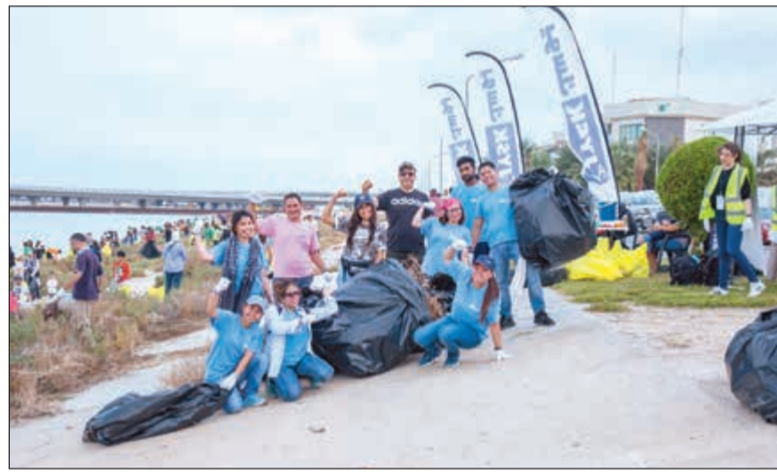
فريق «يوسك» التطوعي خلال حملة التنظيف

أعلنت العلامة التجارية يوسك، إحدى العلامات التجارية التي تمثلها شركة علي عبدالوهاب المطوع التجارية في قطاع الأثاث، عن مشاركتها إلى جانب أكثر من 600 شخص من أكثر من 20 جهة محلية نهار الجمعة 9 نوفمبر بـ «اليوم الوطني لتنظيف الشواطئ» الذي تنظمه فريق «موطني» التطوعي في الكويت، وتمت فيه إزالة 5 أطنان من النفايات كما تمت إعادة تدوير 15 كم من النفايات البلاستيكية بنجاح. وجاءت هذه الفعالية احتتاماً لحملة «يستاهل وطني» التي بدأت 15 سبتمبر الماضي واستمرت حتى 9 نوفمبر، حيث انطلق المشاركون في هذا اليوم من الساعة 1:00 صباحاً حتى الساعة 4:00 ظهراً، بعد أن تم تقسيمهم إلى 10 فرق وتوزعهم على مسافة 40 كم، وقاموا بتنظيف الشاطئ وفرز النفايات لإعادة تدويرها. ويهدف التعامل مع تغير المناخ والحد منه وإعادة استخدام المخلفات وإعادة تدويرها، تضمنت هذه الحملة العديد من الورش والدروس والتدريب العملية للمشاركين عن كيفية التنظيف من خلال الالتزام بمعايير وقواعد محددة