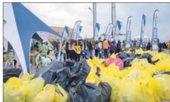
مشاركة مميزة من فريق «يوسك»

لحماية البيئة وتجنب تلوثها والتمييز بين أنواع النفايات الضارة والقابلة للتكرار والتحليل. وأكدت «يوسك» من خلال رعايتها للحملة ومشاركة موظفيها بكل النشاطات حرصها على ترسيخ مبدأ المسؤولية الاجتماعية وحماية البيئة الذي يتجسد في منتجاتها الصديقة للبيئة والحاصلة على شهادة «مجلس الإشراف على الغابات» FSC، وكذلك المنتجات من الأقمشة والمنسوجات التي تحتوي على