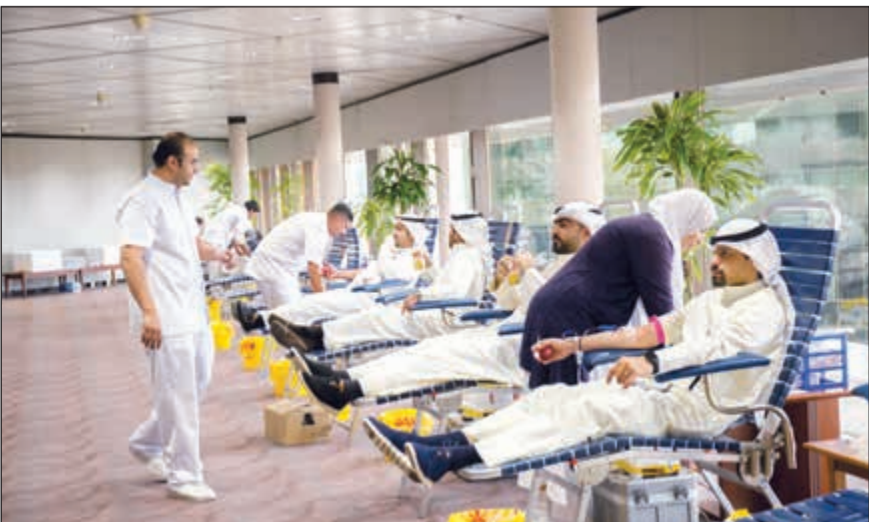
جانب من تبرع موظفي بورصة الكويت بالدم

تعزيزاً لجهودها الرامية إلى دعم المجتمع المحلي ورد الجميل له، نظمت بورصة الكويت مؤخراً في مقرها الرئيسي حملة للتبرع بالدم بالتعاون مع بنك الدم الكويتي على مدار يوم كامل، وذلك لإتاحة الفرصة أمام أكبر عدد من الموظفين للمشاركة في هذه الحملة. وتهدف هذه المبادرة إلى غرس الشعور بالمسؤولية الاجتماعية بين موظفي بورصة الكويت، وتشجيعهم على المساهمة بفعالية في تحقيق رفاه المجتمع من خلال أخذ زمام المبادرة للمشاركة في الأعمال الخيرية والإنسانية. وقد حظيت المبادرة بإهتمام كبير من الموظفين الذين حرصوا على التبرع بالدم، مما يعكس روح الإيثار الذي يتمتع بها الموظفون، وإيمانهم القوي بأهمية دعم ومساعدة المحتاجين للتبرع بالدم، وتعد