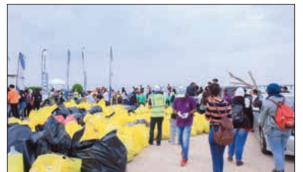
مشاركين بالحملة وجمع أكياس النفايات