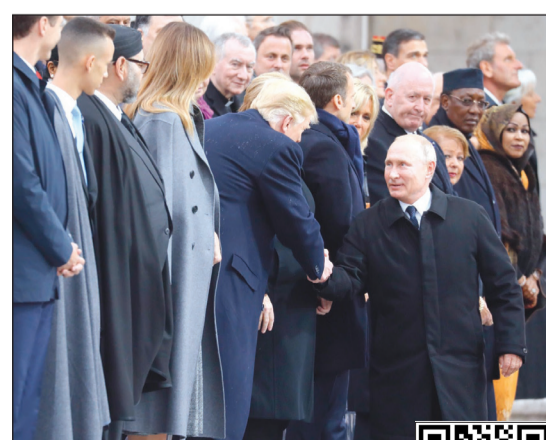
فلاديمير بوتين مسافحا دونالد ترامب خلال الاحتفال بمئوية الحرب العالمية الأولى