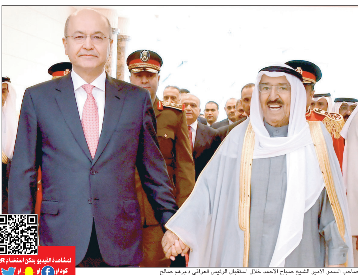
صاحب السمو الأمير الشيخ صباح الأحمد خلال استقبال الرئيس العراقي د. برهم صالح

صاحب السمو والرئيس العراقي بحثا العلاقات الثنائية والسعي المتواصل للارتقاء بأطر التعاون المشترك وتعزيز الجهود المبذولة في مكافحة الإرهاب د. برهم صالح: أعدنا بعض مقتنيات الديوان الأميري التي سرقت خلال الغزو بالإضافة إلى ممتلكات وأرشيف بلغ حجمه 3 أطنان وهي رسالة تعني أننا مصرون على إعادة الحق لأصحابه الكويت معنية بالمشاريع التي ستنفذ في البصرة ونريد التنسيق التام مع أشقائنا نحن في حوار مستمر مع أميركا ويجب مراعاة خصوصية العراق بشأن العقوبات الإيرانية 03 04