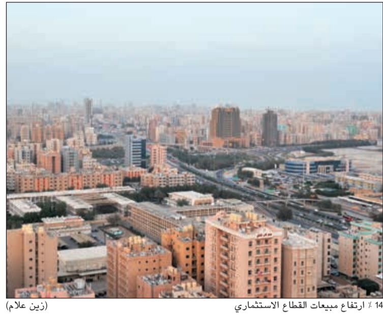
14 ارتفاع مبيعات القطاع الاستثماري (زين علام)

ارتفاع مبيعات وأسعار القطاع الاستثماري وأضاف التقرير أن مبيعات القطاع الاستثماري بلغت