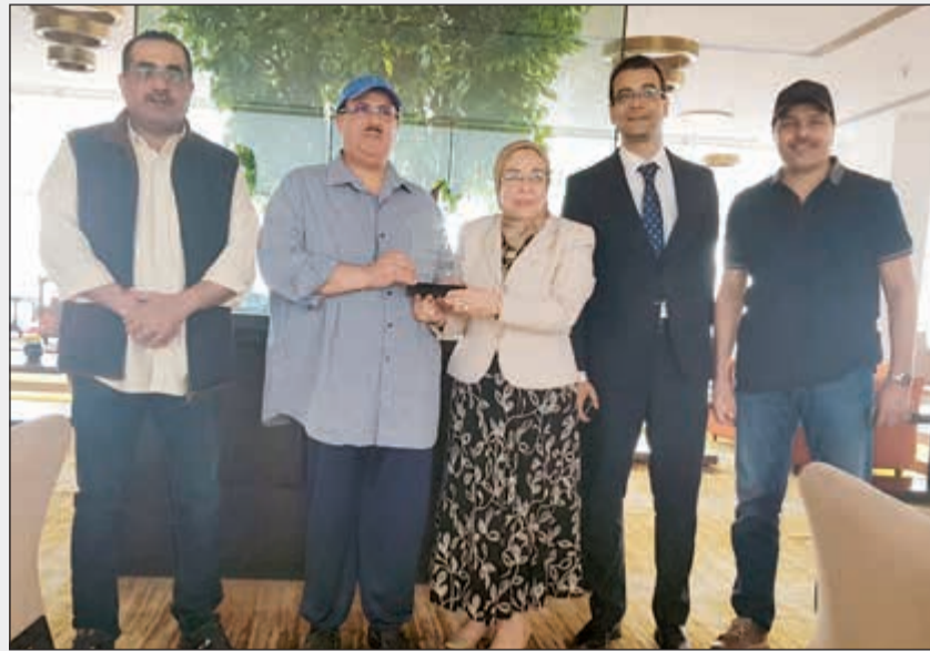
إذاعة صوت العرب تكرم الشيخ فهد المبارك

الصورة المشرفة لديرتنا الغالية، موجهها الشكر إلى وزير الإعلام محمد الجبري ووكيل الوزارة طارق المزرم على الدعم اللامحدود للوفد الكويتي كي يتمكن من رفع سمعة ومكانة الكويت، كما توجه بالشكر للاتحاد العام للمنتجين العرب على الجهود التي بذلت مع الوفود المشاركة، وإلى مصر وشعبها على حفاوة الاستقبال وحسن الضيافة. وتابع المبارك: أهدى هذا الإنجاز الكويتي إلى حضرة صاحب السمو أمير البلاد وإلى سمو ولي العهد وإلى سمو رئيس مجلس الوزراء وإلى جميع العاملين في «الإعلام» وإلى الشعب الكويتي. جدير بالذكر أن «موندريال القاهرة للأعمال الفنية والإعلام 2018» اختار الكويت ضيف شرف هذه العام، وذلك لدورها إعلامياً وثقافياً وفنياً في الوطن العربي، ويشير إلى أنه قد تم تكريم متبادل بين الوكيل المساعد لقطاع الإذاعة الشيخ فهد المبارك وإذاعة صوت العرب على هامش الموندريال.