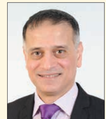
إعداد: د. طارق البكري