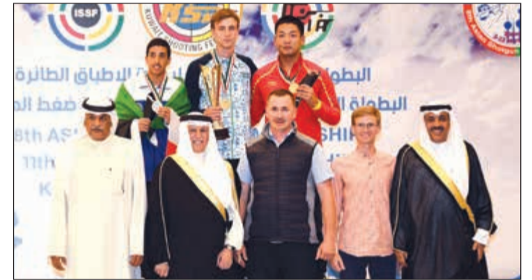
تتويج الرماة الفئزتين بمسابقة سكيت ناشئين فردي

وفي مسابقة رماية (البندقية 10 امتار) لفئة العمومي مختلط احتل المنتخب الصيني المركزين الأول والثاني حاصداً الذهبية والفضية في حين ذهب المركز الثالث والميدالية البرونزية لمنتخب اليابان. وفاز منتخب الهند بالمركزين الأول والثالث في مسابقة رماية (البندقية 10 امتار) لفئة الناشئين مختلط لجناب المدينتين الذهبية والبرونزية في حين فاز منتخب الصين بالمركز الثاني والميدالية الفضية. وأعرب رئيس اللجنة المنظمة للبطولة رئيس النادي الكويتي للرماية