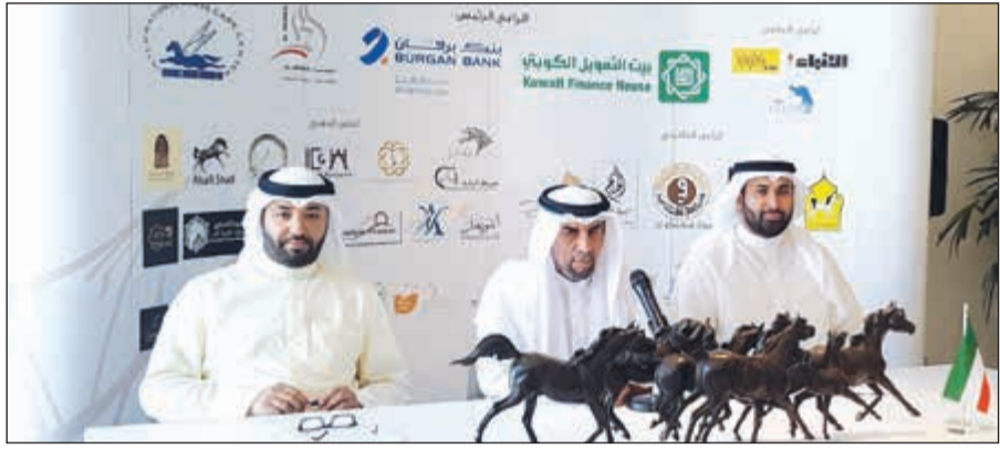
جانب من المؤتمر الصحفي

لمهرجان الكويت الوطني للجواد العربي من قبل المشاركين من ملاك ومربي الخيل العربية والكويتية. وتشرفت عن القيمة الإجمالية لجوائز مهرجان الكويت الوطني للجواد العربي، لافتة إلى أنها تزيد على ربع مليون دولار (81 ألف دينار)، مشيرة إلى انجاز آخر مهم لمركز الجواد العربي (المربط الرسمي للكويت الذي تؤول تبعية للديوان الأميري) وهو إضافة لجنة البطولات