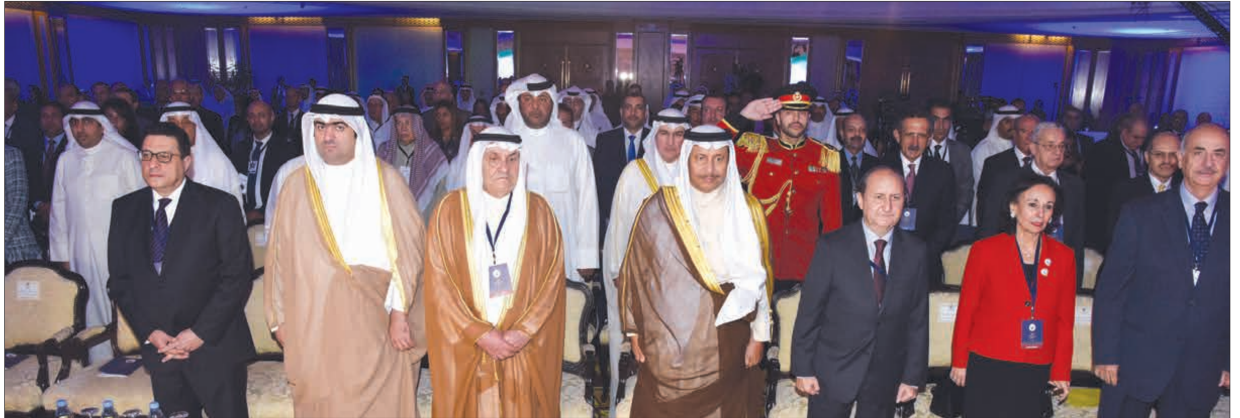
سمو رئيس مجلس الوزراء الشيخ جابر المبارك وخالد الروضان وم. عمرو نصار ومحمد جاسم الصقر ووفاء القطامي والسفير المصري طارق الفوني ومعتمد الألفي في مقدمة الحضور خلال مؤتمر مجلس التعاون المصري - الكويتي