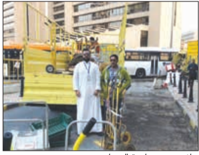
جانب من مصادرة العربات

قامت النوبة «ب» بمركز نظافة المدينة التابع لمراقبة النظافة العامة بإدارة النظافة العامة في العاصمة بحملة لضبط الباعة الجائلين في منطقة المباركية، والتي أسفرت عن مصادرة 30 عربة إلى جانب تحرير 5 مخالفات.