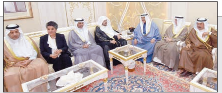
سمو الشيخ ناصر المحمد مستقبلاً رئيس مجلس الشورى السعودي، عبدالله آل الشيخ بحضور رئيس مجلس الأمة مرزوق الغانم والشيخ دسام الجابر وصفاء الهاشم وعودة الرويعي ود. اسماعيل الشطي

ناصر المحمد أقام مأدبة غداء على شرف رئيس مجلس الشورى السعودي