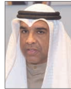
المستشار عبدالرحمن النمش

لتعزيز النزاهة والشفافية ومكافحة الفساد. وأشار إلى أن هذه المدونة جاءت لتؤكد على ما يتمتع به رجال النيابة العامة من نزاهة وإخلاص ومثابرة معهودة فيهم وحرص على إقرار مبادئ العدالة والمساواة والسهر على تطبيق القانون ورعاية مصالح المواطنين والانضباط والالتزام بقواعد السرية واحترام العمل وتنمية قدراتهم العلمية والقضائية وحظر التكبسب من حصانتهم القضائية. ودعا رئيس «نزاهة»