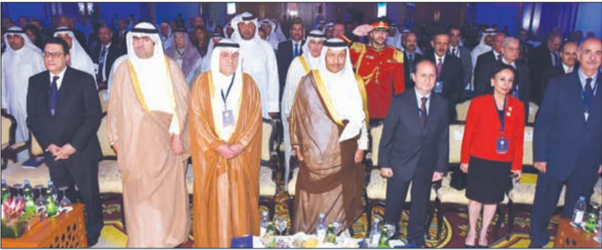
سمو رئيس مجلس الوزراء الشيخ جابر المبارك وخالد الروضان وم. عمرو نصار ومحمد جاسم الصقر ووفاء القطامي والسفير المصري طارق القوني ومعنزي الألفي في مقامة حضور مؤتمر مجلس التعاون المصري - الكويتي

مؤتمر مجلس التعاون المصري الكويتي يرسم أجندة اقتصادية لتهيئة الفرص للقطاع الخاص