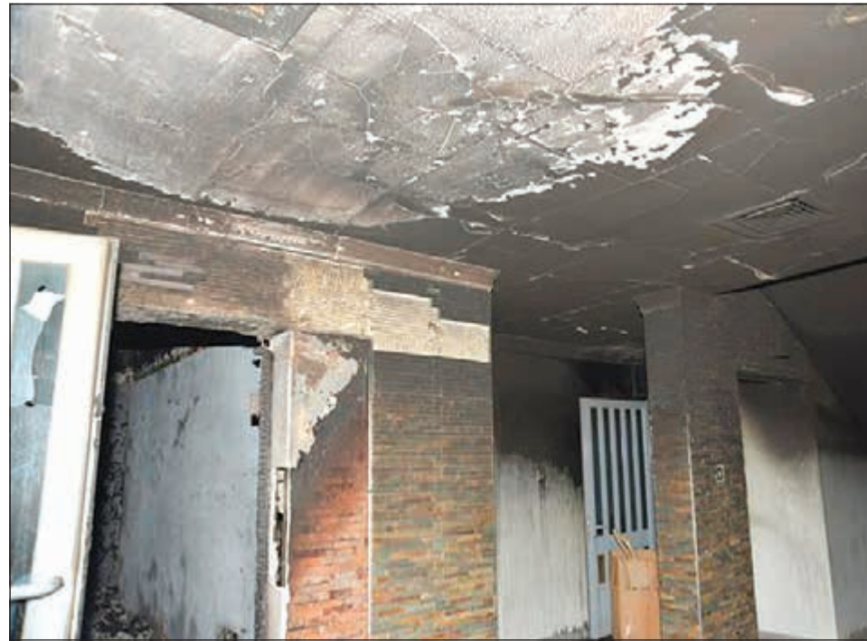
التيران دمرت سقف الطابق الأول