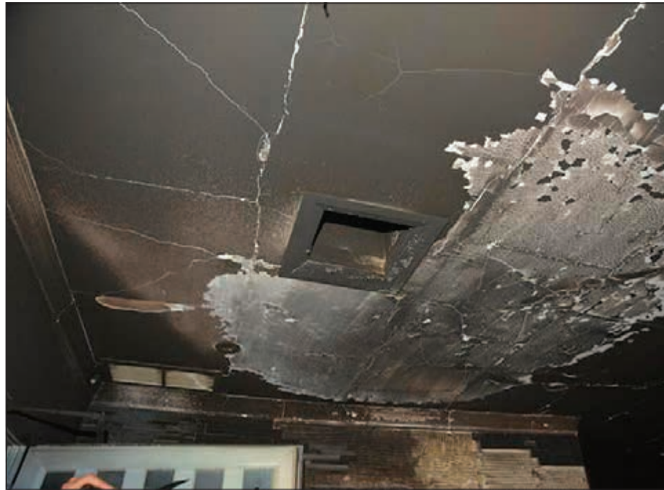
آثار الحريق تبدو واضحة في سقف الصالة