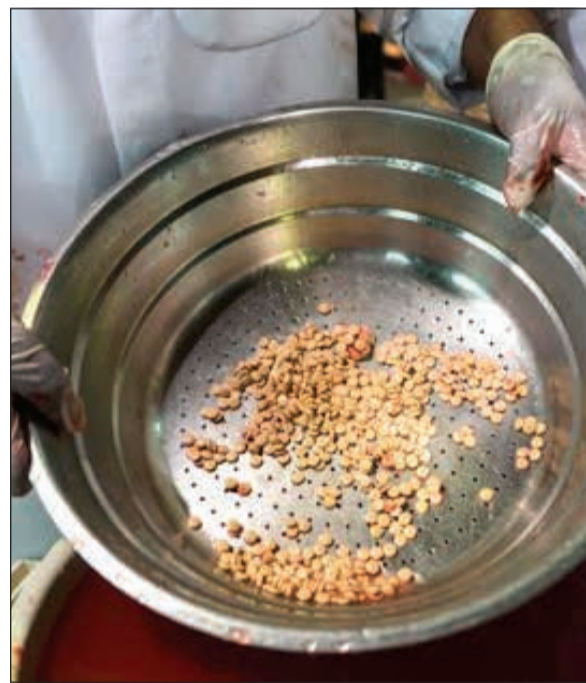
حبوب الكبتاغون وقد تلونت بالأحمر جراء إختلاط الكاتشاب بها