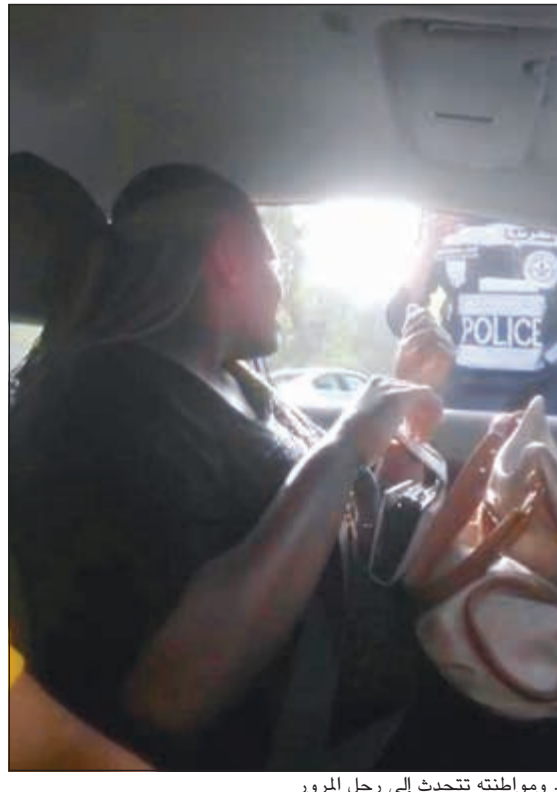
.. ومواطنته تتحدث إلى رجل المرور