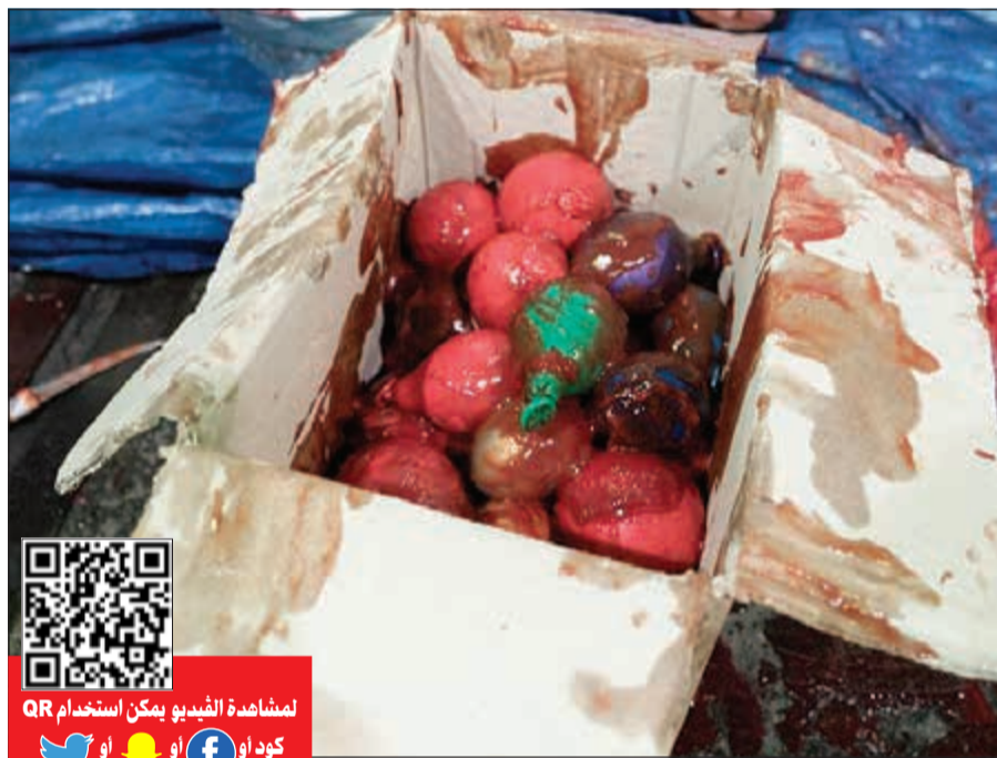
الحبوب أخفيت داخل أكياس بلاستيكية