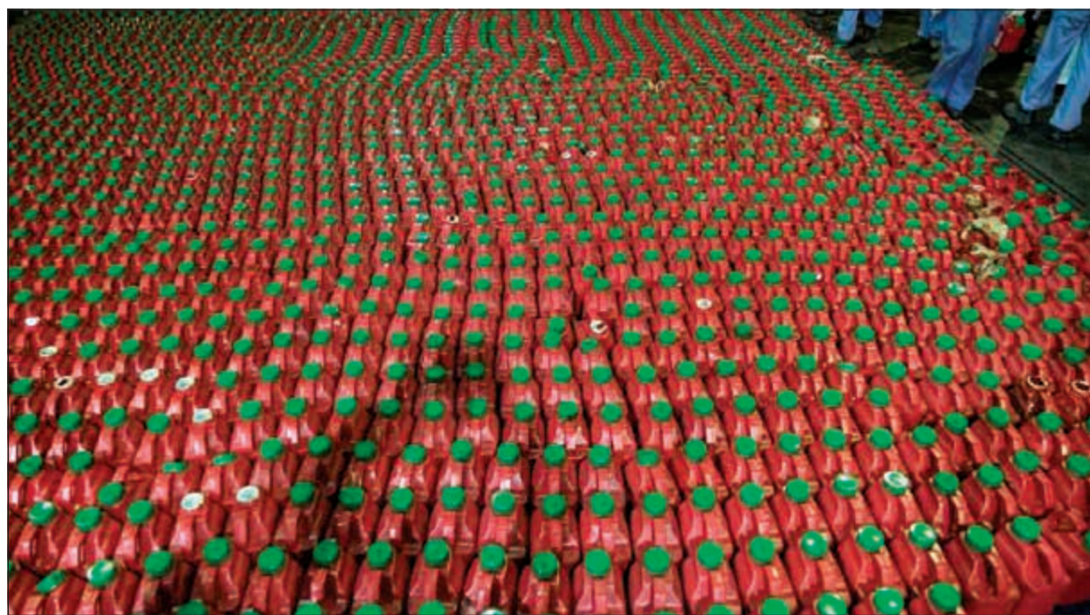
جراكن الكاتشاب والتي أخفيت فيها الحبوب المخدرة