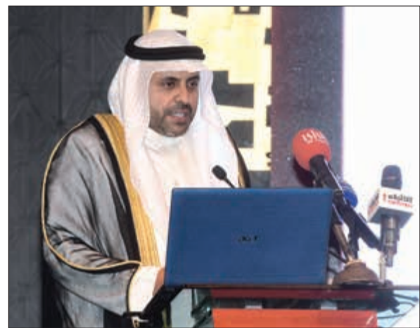
الجبري ملقياً كلمته خلال حفل افتتاح المؤتمر

أكد وزير الإعلام وزير الدولة لشؤون الشباب محمد الجبري إيمان القيادة السياسية العليا، وفي مقدمتها صاحب السمو أمير البلاد الشيخ صباح الأحمد، وسمو ولي العهد الشيخ نواف الأحمد، وسمو رئيس مجلس الوزراء الشيخ جابر المبارك، بأهمية تمكين الشباب عبر تضامير كل الجهود الرسمية والأهلية لتحقيق هذه الغاية. وأضاف الجبري، في كلمته خلال افتتاح مؤتمر «تمكين الشباب السابع»، أن الأمم تقوم على عاتق الشباب وجهودهم، لافتاً إلى أن سمو أمير البلاد أعطى الشباب اهتماماً كبيراً عبر توجهاته السامية التي تصب في اتجاه تمكينهم وفتح الآفاق أمامهم لتطوير قدراتهم الإبداعية، للمشاركة بفعالية في النهضة والتنمية.