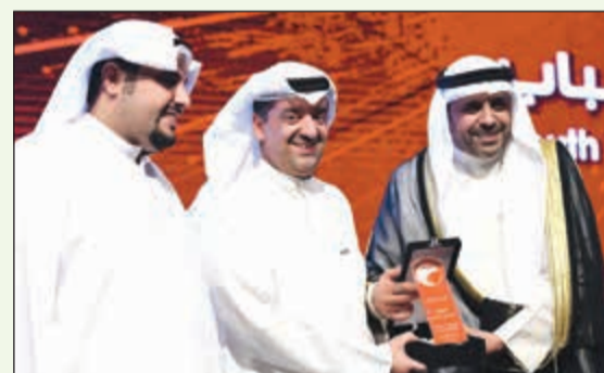
الجبري مكربا الخشتي على شركة زين الاستراتيجية

شاركت شركة زين حفلا لافتتاح مؤتمر تمكين الشباب بسنخته السابعة، والذي أقيم في فندق فورسيزونز تحت رعاية صاحب السمو أمير البلاد الشيخ صباح الأحمد، بحضور ممثل سمو أمير البلاد وزير الإعلام ووزير الدولة لشؤون الشباب محمد الجبري. وذكرت الشركة في بيان صحافي أن مشاركتها في حفل الافتتاح أتت ضمن شركتها الاستراتيجية لمؤتمر