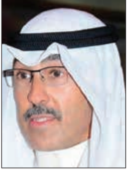
الشيخ فواز الخالدي

قام محافظ الأحمدية الشيخ فواز الخالدي بجولة تفقدية صباح أمس على عدد من مناطق الأحمدية والشوارع الرئيسية بدءاً بالطريق الساحلي مروراً بمناطق الرقة وهدية حتى الدائري السابع انتهاء بمدينة الأحمدية للاطمئنان على معالجة آثار الأمطار الغزيرة التي شهدتها البلاد مساء أمس الأول. وعقب الجولة قال الخالدي: لله الحمد الأمور مطمئنة وكل الجهات المعنية تقوم بدورها على الوجه الأمثل ومنتسبوها بذلوا جهوداً حثيثة وصولاً إلى أقصى درجات الرعاية والاهتمام بسلامة وأمن المواطنين والمقيمين، موجهاً الشكر إلى مسؤولي ومنتسبي الجهات المختصة الذين قاموا بواجبهم وكانوا على أهبة الاستعداد للتعامل مع الحدث. وناشد الخالدي المواطنين بوجه عام وأهالي الأحمدية على نحو خاص بتوخي الحذر تزامناً مع سوء الأحوال الجوية، حرصاً على أمنهم، متمنياً السلامة للجميع.