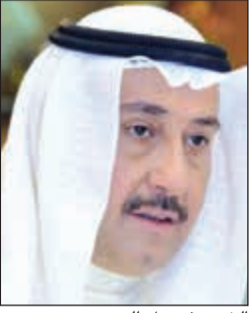
الشيخ فيصل الحمود

ورصد الاضرار في جميع مناطق المحافظة، مثنياً في الوقت ذاته جهودهم في الحفاظ على سلامة المواطنين والمقيمين من خلال التجاوب الفعال لعمليات الأمن والسلامة.