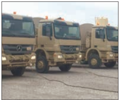
جهوزية تامّة لقوة الواجب

أكدت رئاسة الأركان العامة للجيش جهوزية وتفعيل قوة الواجب المختصة لاسناد ودعم الجهات الحكومية أمس لمعالجة الآثار التي خلفتها تغيرات الأحوال الجوية التي مرت بها البلاد. وقالت مديرية التوجيه المعنوي في الجيش في بيان صحافي انه تم رفع حالة الاستعداد للوحدات المكلفة بالواجب في مثل هذه الظروف وعلى مدار الساعة إضافة إلى فتح قنوات اتصال مباشرة مع جميع الجهات المعنية في البلاد. وأضافت أن جميع وحدات القوة العسكرية بالجيش والمكلفة بالواجبات الدفاعية والحماية مستمرة بأداء أعمالها دون تغيير.