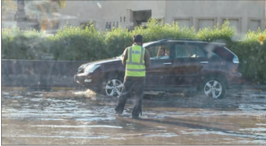
تراكم الأمطار أثر على حركة السير في بعض الطرق

قالت مصادر خاصة لـ «الأنباء» ان قرار مجلس الخدمة المدنية بإحالة الحصان إلى التقاعد نافذ. وأوضحت أن القول بأن القرار صدر يوم عطلة مردود عليه لأن أمس ليس عطلة رسمية كيوم الجمعة إنما يعتبر يوم راحة لطارئ معين، وهذا لا يمنع مجلس الخدمة المدنية في أن يقرر ما يراه، ونضيف: قبل عامين تشكلت حكومة جديدة وأقسمت يوم سبت وهو يوم راحة. وأضافت المصادر ان الوزارات تستأنف الدوام الرسمي اليوم.