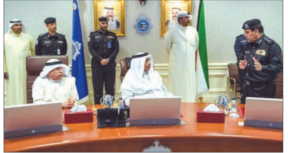
سمو رئيس مجلس الوزراء الشيخ جابر المبارك يستمع إلى شرح عن كيفية التعامل مع الأزمة بغرفة اتخاذ القرار في «الداخلية»