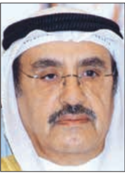
الفريق أول م. أحمد الرجيب

بذلك نوعاً من الاطمئنان في النفوس، مؤكداً على أن أجهزة الطوارئ لا تزال تواصل عملها وفي حالة استعداد. وثمن الرجيب جهود كل العاملين في مختلف أجهزة الطوارئ العاملة في محافظة مبارك الكبير خاصة «الداخلية»، و«الأشغال» و«الإطفاء» و«البلدية»، و«الكهرباء»، مؤكداً حرص هذه الأجهزة على التجاوب مع كل بلاغات أهالي محافظة مبارك الكبير بالسرعة الممكنة إلى جانب التنسيق والتكاتف فيما بينها على التخلص من المياه المتراكمة في الشوارع وسحب مياه تسربت إلى بعض المنازل.