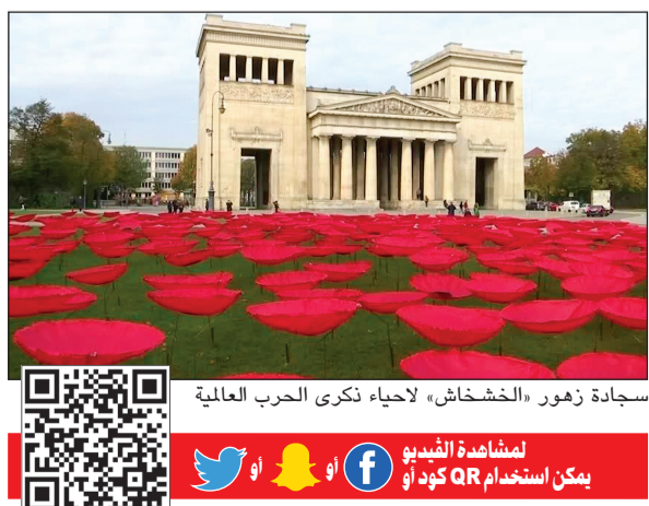
سجادة زهور «الخشخاش» لآحياء ذكرى الحرب العالمية الأولى