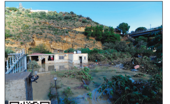
جانب من الأثار المترتبة على العواصف الإيطالية