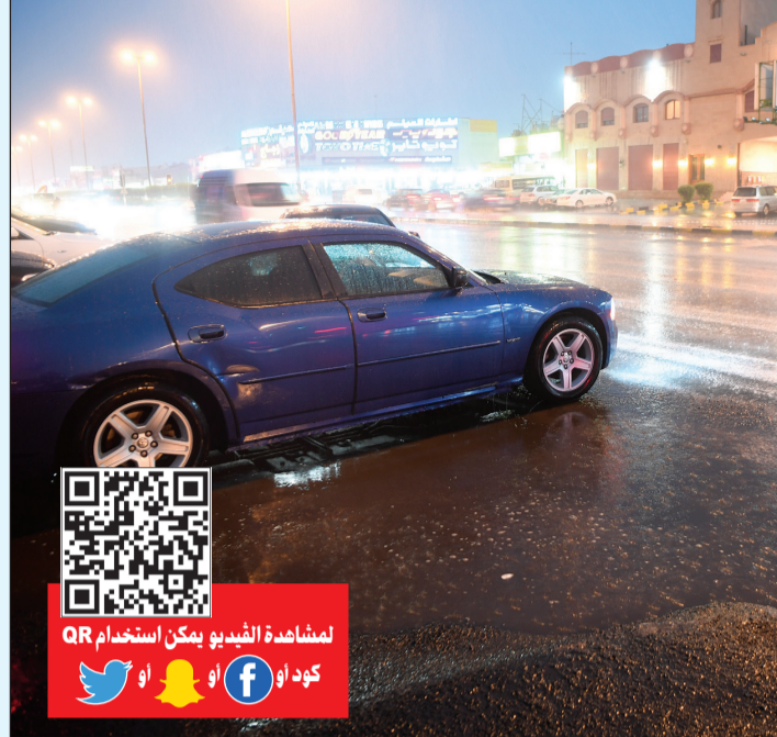
أمطار متفرقة (محمد هاشم)