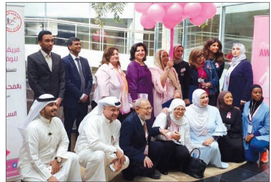
جانب من الحملة التوعوية بسرطان الثدي

النسائي الذي تعيشه كلية بوكسهل كونها الكلية الوحيدة الخاصة للبنات فقط، كما شددت على أهمية الكشف المبكر ومعرفة التشخيص والعلاج المناسب والوقاية من كل الأمراض لأن ذلك من أهم الوسائل الفعالة للمحافظة على حياة المرأة. وقامت المستشفيات المشاركة بتقديم الفحوصات الأولية للطالبات والمدرسات إضافة الى النصائح المهمة للحفاظ على الصحة العامة ومدى أهمية الفحص الدوري وصلة الغذاء والسرطان وأهمية المحافظة على غذاء متوازن وتعلم تناول الخضار والفاكهة بشكل منتظم والتقليل من تناول الأطعمة الدهنية، وقد شددت على أهمية ممارسة الرياضة بشكل يومي وعن تأثيرها في صحتنا البدنية والذهنية، واستمعت الحضور وخاصة الطالبات بالمعلومات المقدمة، حيث كان يوماً تفاعلياً مليئاً بالفائدة والوعي نحو حياة أفضل خالية من الأمراض.