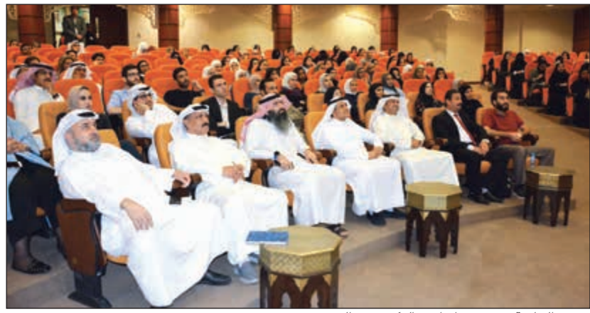
رئيس الجامعة محمد بن إبراهيم الزكري من الحضور