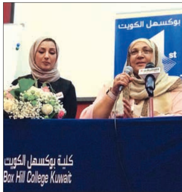
متحدثتان خلال الحملة