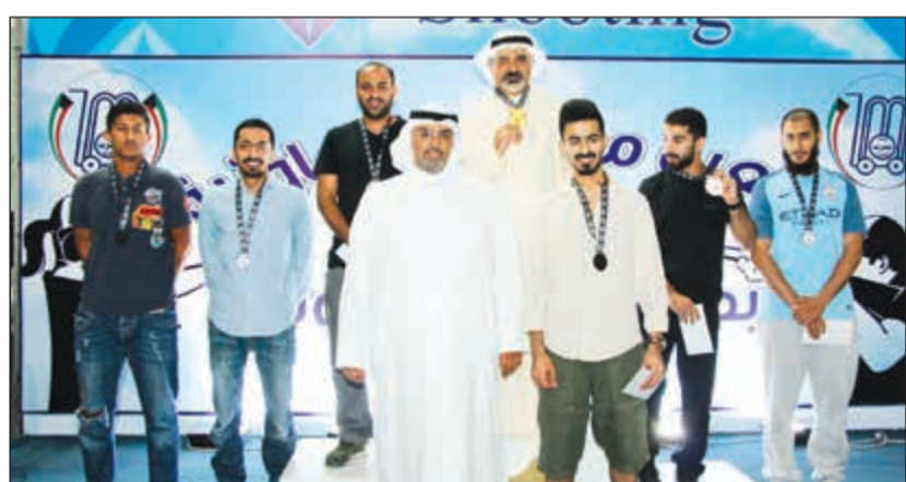
لقطة تذكارية خلال تكريم الفائزين

ويقول القناعي: أملين أن تكون قد وفقتنا في إخراجها بصورة الطيبة كما نأمل أن تسنح لنا الفرصة لتنظيمها مرات أخرى مع الأنشطة الحديثة والمتنوعة ولا يفوتني أن أتقدم بالشكر والعرفان لكل من ساهم وشارك في إنجاح هذه البطولة للرجال والنساء ولكل من شارك برعايته لتنظيم البطولة وتشريفه لنا بمتابعة أفعالها، ونشكر أيضاً إدارة اتحاد الرماية لجهودهم الكريمة في دعم رياضة الرماية وتطويرها بالكويت. وأوضح القناعي: أن رعاية هذه المبادرة الرياضية الاجتماعية جاءت تحت مظلة المسؤولية الاجتماعية والاستدامة في دعم الأنشطة الرياضية، حيث تحرص الجمعية على دعم البرامج والأنشطة التي تحفز الأهداف الاجتماعية لخدمة المساهمين وأبناء المنطقة، مؤكداً أن تعاونية مشرف مستمرة في تخصيص مساهماتها الاجتماعية تجاه الأنشطة بانواعها لتعكس ذلك القيم التي أسست من أجلها لجنة العمل الاجتماعي.