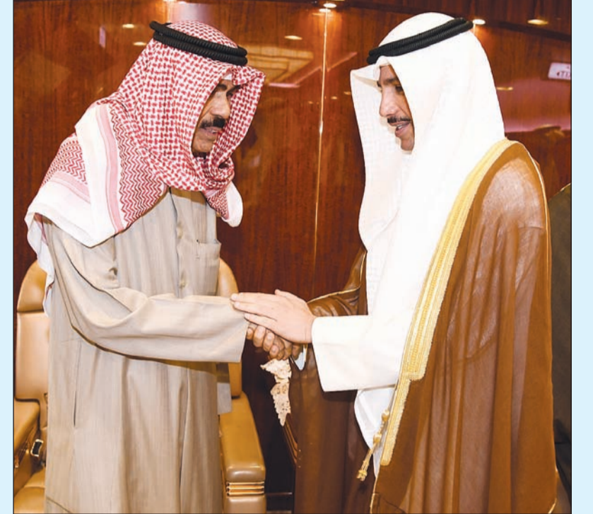
سمو ولي العهد الشيخ نواف الأحمد مضافاً رئيس مجلس الأمة مرزوق الغانم قبيل مغادرته البلاد أمس

أوضحت مصادر برلمانية في تصريحات خاصة لـ «الأنباء» أن الحكومة لجأت إلى البرنامج الوطني للاستدامة المالية لأنه لا يحتاج إلى إصدار تشريعات من مجلس الأمة، عكس برنامج الإصلاحات الاقتصادية والمالية الذي يتطلب تشريعات. وذكرت المصادر أن البرنامج رقابي يتابع ويرصد ويعمل على وقف وتقنين وترشيد المصروفات الحكومية، وتحقيق إصلاحات اقتصادية ومالية، من خلال معالجة الاختلالات المالية وبصفة خاصة اختلالات الميزانية العامة للدولة والقضاء على أوجه الهدر والصراف غير المقتنن. وأضافت المصادر: وبناء على ذلك لا يجوز للحكومة إخراج أي تشريعات خاصة بإقرار الضرائب في برنامج الاستدامة. وتمتعت المصادر جهود وزارة المالية التي ضاعفت جهودها لإعداد مشروع قانون جديد لضبط إعداد الميزانيات العامة والرقابة على تنفيذها والحسابات الختامية. وتمتعت المصادر أيضاً موقف رئيس اللجنة المالية النائب صلاح خورشيد الذي أعلنه في 3 أكتوبر الماضي وأكد فيه «أن البرنامج الوطني للاستدامة لا يحتاج إلى تشريعات كما هو الحال مع الوثيقة الاقتصادية». هذا وسجل مراقبون مختصون في تصريحات خاصة لـ «الأنباء» تحفظاً على تقرير برنامج «استدامة» المحال من الحكومة والذي خضع للمناقشة في اللجنة المالية البرلمانية في 28 أكتوبر الماضي ورفض بالإجماع. وقال المراقبون أن التقرير نص على أن قانون السجل التجاري من ضمن التشريعات المقترحة لتطوير البيئة التشريعية في الدولة مع أن مجلس الأمة وافق في جلسة عُقدت بتاريخ 17 أبريل الماضي على قانون السجل التجاري وأحاله للحكومة.