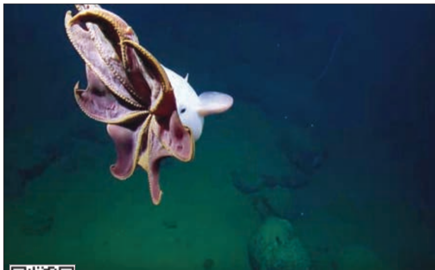
الأخطبوط «دامبو» يعيش عادة في قاع المحيط