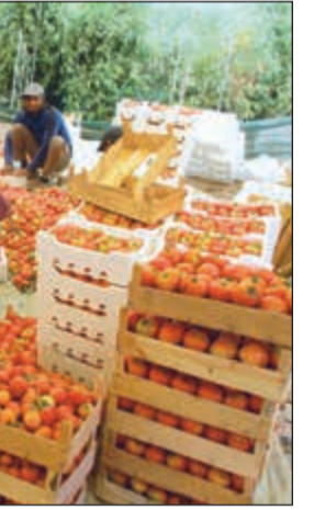
الفلفل الحار.. إنتاج الوفرة