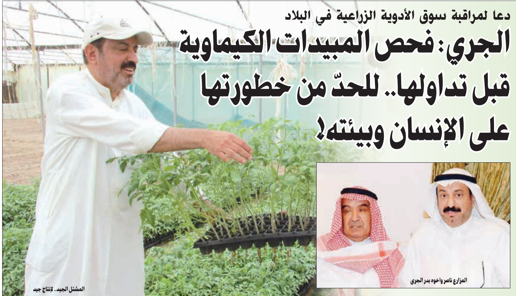
الممثل الجيد.. إنتاج جيد