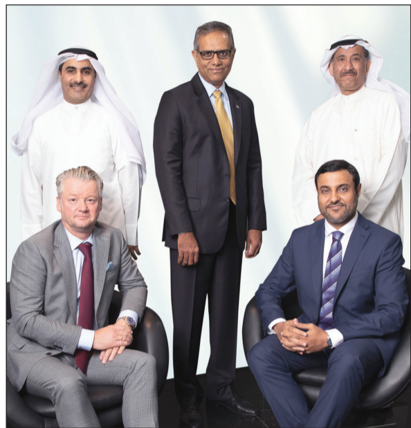
الإدارة التنفيذية العليا لـ «إيكويت»

وقال الرئيس التنفيذي لإيكويت د.راميش راماجندران «يمثل ارتفاع نتائج إيكويت في الربع الثالث من عام 2018 دلالة واضحة على استمرار جهود وتفاني والتزام موظفي إيكويت، فقد استطعنا الاستفادة من تماسك أسعار مواد الإيثيلين جلايكول، والبولي إيثيلين وتبريفات البولي إيثيلين مع استمرار الكفاءة العالمية في مختلف العمليات، وما زلنا نتعامل مع السلامة المهنية باعتبارها الأولوية القصوى