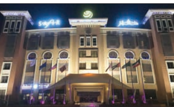
فندق سيفر الفنتاس متوشح باللون الوردى