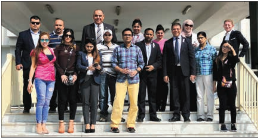
فريق الفندق خلال زيارتهم لمركز حسين مكي الجمعة

الكويت ويعتبر الفندق ذو الخمس نجوم والذي يقع بالفنتاس المكان المناسب لرجال الأعمال والسياح، بما يقدمه من نشاطات وخدمات وتسهيلات متنوعة، ويستطيع الضيوف الاختيار ما بين 150 غرفة وجناحاً إلى شقق سكنية مكملة، بغرفة أو غرفتي نوم، ويوفر متعة العيش الجميل والمناظر المذهلة والفأخرة للمدينة الخليج العربي، بالإضافة إلى مركز مجهز للرياضة وقضاء وقت الفراغ، ووجود العديد من المطاعم والفهي النموذجية كل ذلك يجتمع ليشكل واحه من السحر الذي لا يقاوم في الكويت.