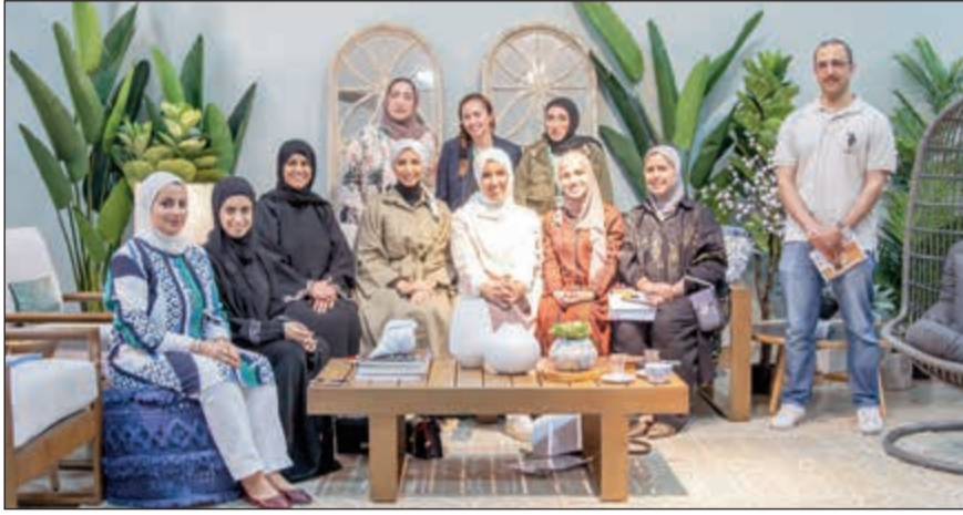
المشاركون بورشة العمل في «صفاة هوم»

وبيئة تسوق مريحة مع خدمات غنية بالتميز لتحقيق أعلى مستويات رضا العملاء، واستمرت في التطور المستمر منذ أن بدأت نشاطها بشكل مستقل تحت هذا الاسم منذ أكثر من 10 سنوات كمعرض للأثاث في معرض الري. أما اليوم، فتحتل صفاة هوم مكانة متميزة في السوق المحلية بما تقدمه من تشكيلة رفيعة المستوى من الأثاث المنزلي، والإكسسوارات، والسيراميك والصحي والطبخ في: معارضها العديدة في: الري، الشويخ، الفحيحيل، مجمع السلال والهيرواء. حيث تحرص على توفير أحدث وأرقى التصميمات التي تختارها بعناية من أشهر العلامات التجارية المحلية والعالمية.