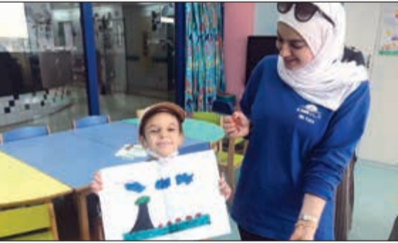
اهتمام كبير بالأطفال المرضى

وكان الهدف الأساسي من الزيارة نشر الأجواء الإيجابية والترفيه عن الأطفال المصابين بمرض السرطان وإدخال البهجة والسرور إلى أنفسهم. وقد اشتملت الزيارة على العديد من الأنشطة الترفيهية والتعليمية والبرامج الإبداعية التي تثير روح الأمل والسعادة في نفوس الأطفال، وتمكن فريق الاتصال والتسويق من الشركة التجارية العقارية بمساعدة فريق بيدي من عمل