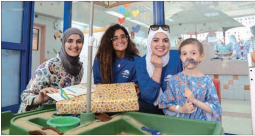
فريق «التجارية العقارية»، خلال الزيارة

وأيضا توفير كل ما هو متاح من وسائل الترفيه لرفع معنوياتهم من أجل التعافي سريعا، داعين المولى عز وجل أن يمن عليهم بالشفاء العاجل. وشكر فريق الاتصال والتسويق كلا من الجمعية الكويتية لرعاية الأطفال في المستشفى ومدير مستشفى البنك الوطني التخصصي للأطفال د.ميثم حسن على هذه الفرصة التي مكنتهم من زيارة الأطفال ومشاركتهم بعض الفعاليات المميزة على أمل الترفيه عنهم وإبعادهم عن أجواء المرض.