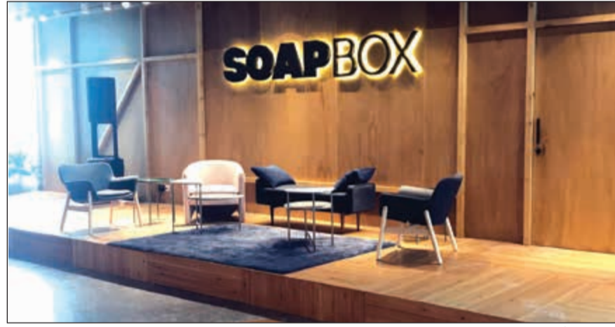
«سوب بوكس» تصميم عصري

سكارف، المتخصصة بالشيليات والاكسسوارات النسائية العصرية، «أريزانا» لبيع الاكسسوارات المنزلية والقطع الفنية من المغرب العربي ومنطقة البحر المتوسط، «نجال بوتيك» لأزياء الأعراس والحلات وفق أرقى التصاميم، «ديلك لوني» للملابس، والاكسسوارات النسائية العصرية، «يونيت» لتصميم وصناعة الهدايا والكعكيات والاكسسوارات، «دار كلمات» لبيع الكتب، وجر حاليا من خلال المرحلة الثانية للتأجير استقبال طلبات استئجار الأثاث لودحات المحلات. وخلال الأشهر القليلة الماضية ومنذ الافتتاح الأولي تم تنظيم مجموعة من الفعاليات والأنشطة في «سوب بوكس» حيث لاقت إقبالا كبيرا. ويهدف خلق قيمة مضافة، فقد تعاون «البروميناد» مع شركة كيوبيكال سيرفيس لحاضنات الأعمال بهدف تقديم الخدمات المتنوعة للمبشرين لتعزيز فرص نجاح وتطور مشاريعهم.