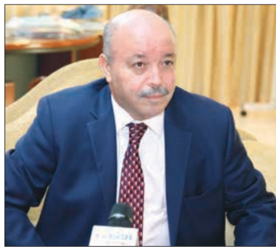
السفير عبدالحاميد عداوي خلال المؤتمر الصحفي

وأشار عداوي إلى العلاقات المميزة التي تجمع القيادة السياسية في البلدين الشقيقين المتمثلة في صاحب السمو الأمير الشيخ صباح الأحمد والرئيس الجزائري عبدالعزیز بوتفليقة، فالعلاقة بينهما قديمة وتعود إلى ستمينيات القرن الماضي عندما كان الزعيمان الكبيران وزيرى خارجية للبلدين، مبيانا أن تولى الرئيس بوتفليقة الحكم في 1999 أعطى للعلاقات بين البلدين انطلاقة كبيرة من خلال اللجنة المشتركة ووضع آليات جديدة للتعاون بينهما وخصوصا لجنة التشاور السياسي التي ستجتمع قريبا. ولفت عداوي - في مؤتمر صحفي عقده في مقر السفارة صباح أمس بمناسبة قرب احتفال بلاده بالعيد الوطني - إلى وجود مشاورات وتبادل للآراء مستمر بين البلدين حول مسائل النفط والغاز في إطار لجنة مراقبة الإنتاج، لافتا إلى وجود تناغم في الموقف الجزائري - الكويتي