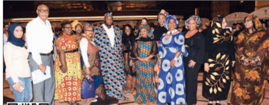
عدد من المشاركين في الاحتفال