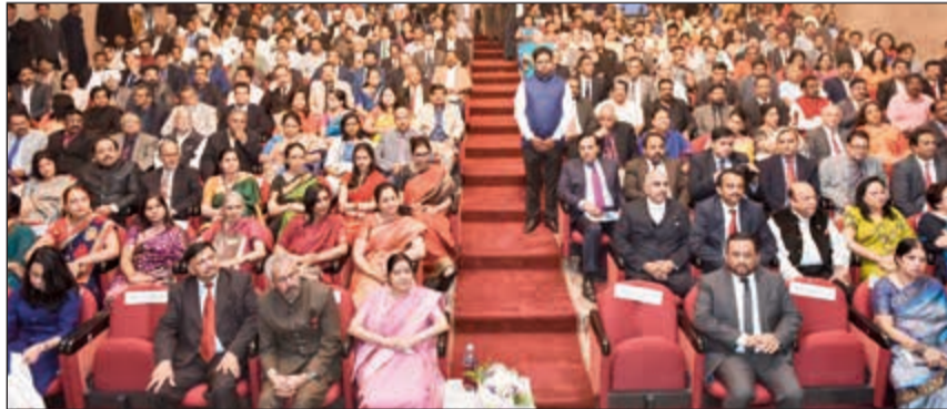
الوزيرة سوشما سوراغ والسفير جيفا ساغار في مقدمة الحضور خلال اللقاء مع أبناء الجالية الهندية

الوزيرة من أبناء الجالية إلى أبرز همومهم ومشاكلهم. وجدير بالذكر أن الوزيرة سوراغ قامت فور وصولها لمقر السفارة بتكريم المهاتما غاندي من خلال وضع أكبل من الورود على تمثاله الموجود في مدخل السفارة.