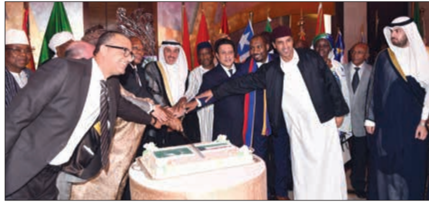
السفير حمد المشعان مشاركا عددا من السفراء الأفارقة قطع كعكة الاحتفال

ورأى المشعان، في تصريحات للصحافيين على هامش مشاركته في يوم أفريقيا مساء أمس الأول في فندق كراون بلازا، أن الاحتفال يعكس الروح التي تمثل أفريقيا ووحدةها، مؤكدا أن علاقة الكويت بأفريقيا قديمة تعود إلى ما قبل النقط من خلال التجارة الكويتية مع أفريقيا، لافتا إلى أن هذه العلاقة امتدت من خلال الصندوق الكويتي للتنمية، حيث قدم الصندوق الكويتي للتنمية أول قرض له لدول أفريقيا في بدايتها تحظى بنصيب الأسد في قروض الصندوق الكويتي للتنمية، مشيرا إلى أن جزءا كبيرا من عمل الكويت في مجلس الأمن هو الاهتمام بالأمن والاستقرار في القارة الأفريقية من خلال التعاون بين الجانبين بالتوقيع على اتفاقيات تعاون وتعزيز العلاقات التجارية ومن خلال الصندوق الكويتي للتنمية لما يخدم مصالح الجانبين. وحول المطالبة الأفريقية للكويت بزيادة استثماراتها وتعزيز الشراكة معها قال