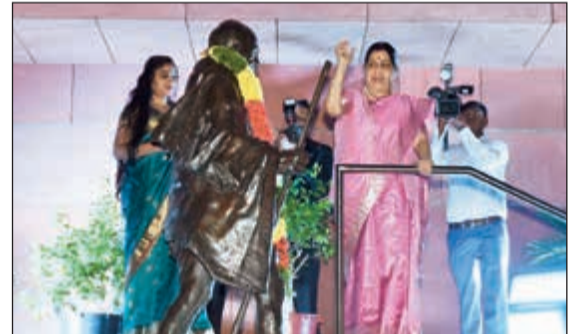
الوزيرة سوشما سوراغ تحيي الحضور بعد أن طوقت عنق تمثال غاندي بإكليل من الزهور (متين غوزال)

في الكويت مساء أمس الأول في السفارة في منطقة الدعية - أن الجالية الهندية قديمة في الكويت وهي من كبرى الجاليات عددا حاليًا وأقلها إثارة للمشاكل، لافتة إلى أنها لمست وجود تقدير كبير لأبناء الجالية في الكويت.