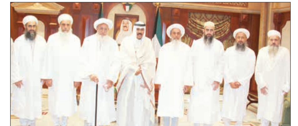
صاحب السمو الأمير الشيخ صباح الأحمد مستقبلاً سلطان البهرة والوفد المرافق

استقبل سمو ولي العهد الشيخ نواف الأحمد صباح أمس رئيس مجلس الأمة مرزوق الغانم. كما استقبل سموه سمو رئيس مجلس الوزراء الشيخ جابر المبارك. كما استقبل سموه نائب رئيس مجلس الوزراء وزير الخارجية خالد الجراح.