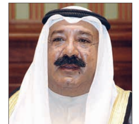
الشيخ ناصر صباح الأحمد

الفتاح من نوفمبر 1954 للجمهورية الجزائرية الديمقراطية الشعبية الشقيقة. وأكد عمق الروابط والعلاقات بين بلدينا الشقيقين، داعياً المولى عز وجل أن يعيد هذه المناسبة عليكم وعلى شعبكم بالخير والأزدهار وعلى قواتكم المسلحة بالرفعة والعزة.