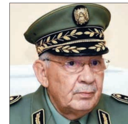
الفرق أحمد قايد صالح