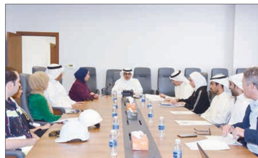
الشيخ أحمد المشعل والوفد المرافق خلال الاطلاع على الموقف التنفيذي لمشروع مبنى الركاب الجديد (II) من م. عواطف النعيم

قام رئيس جهاز متابعة الأداء الحكومي الشيخ أحمد مشعل الأحمد أمس بجولة ميدانية في مشروع مبنى الركاب الجديد (II) في مطار الكويت الدولي لتفقد الأعمال الإنشائية للمشروع الذي تشرف على تنفيذه وزارة الأشغال. وكان في استقبال المشعل والوفد المرافق له في موقع المشروع وكالة وزارة الأشغال م. عواطف النعيم ومدير المشروع م. فيصل الأستاذ إضافة إلى عدد من مهندسي الوزارة القائمين على تنفيذ المشروع. وقال بيان صحفي صادر عن الجهاز إن الشيخ أحمد المشعل اطلع خلال هذه الجولة على آخر مستجدات الموقف التنفيذي للمشروع من خلال عرض مرئي قدمه استشاري الإشراف في المشروع. وأشد المشعل وفقا للبيان بالعمل المبذول لتنفيذ المشروع، داعياً القائمين على تنفيذ المشروع إلى بذل المزيد من الجهد لإنجازه في الوقت الزمني المحدد. وأكد استعداد الجهاز لتذليل أي صعوبات أو عقبات تقف أمام تنفيذ وتشغيل المشروع. وتأتي زيارة الشيخ أحمد المشعل إلى مشروع مبنى الركاب الجديد (II) في مطار الكويت الدولي في إطار الزيارات الميدانية التي يقوم بها الجهاز لتفقد المشروعات الحكومية والأعمال الجارية فيها.