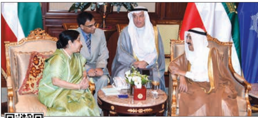
صاحب السمو الأمير الشيخ صباح الأحمد مستقبلاً وزيرة الشؤون الخارجية في جمهورية الهند سوشما سوراج

وبعث سمو ولي العهد الشيخ نواف الأحمد ببرقية تعزية إلى الرئيس محمد أشرف غني، ضمنها سموه خالص تعازيه وصادق مواساته بضحايا المروحية. كما بعث سمو رئيس مجلس الوزراء الشيخ جابر المبارك ببرقية تعزية مماثلة.