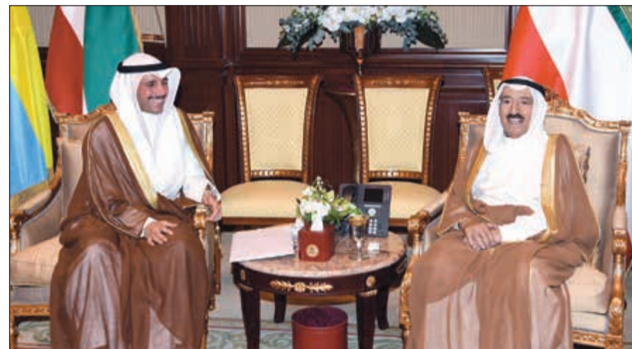
صاحب السمو الأمير الشيخ صباح الأحمد مستقبلاً رئيس مجلس الأمة مرزوق الغانم

كما استقبل سموه رئيس مجلس الأمة مرزوق الغانم. واستقبل سموه سمو رئيس مجلس الوزراء الشيخ جابر المبارك. كما استقبل سموه نائب رئيس مجلس الوزراء وزير الخارجية الشيخ صباح الخالد ووزيرة الشؤون الخارجية في جمهورية الهند سوشما سوراج والوفد المرافق، وذلك