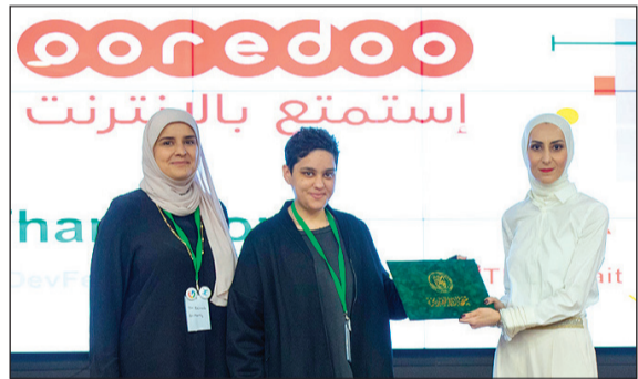
جانب من ملتقى «2018 DevFest»