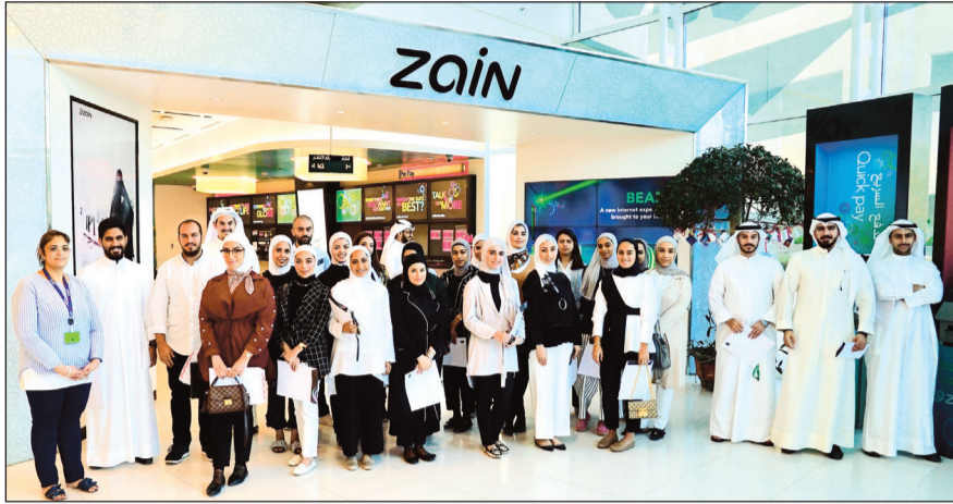
طلبة وطالبات «لويك» في مقر «زين» الرئيسي

استضافت شركة زين 32 طالبا وطالبة من منتسبي برنامج «لويك» للعمل بدوام جزئي، وذلك للعمل في قطاعات وإدارات الشركة المختلفة خلال الفترة من أكتوبر حتى ديسمبر 2018 ومنحهم فرصة اكتساب خبرات العمل في القطاع الخاص، حيث يأتي البرنامج ضمن شراكة زين الاستراتيجية لمؤسسة «لويك» غير الربحية لتتمة وتطوير مواهب الشباب.