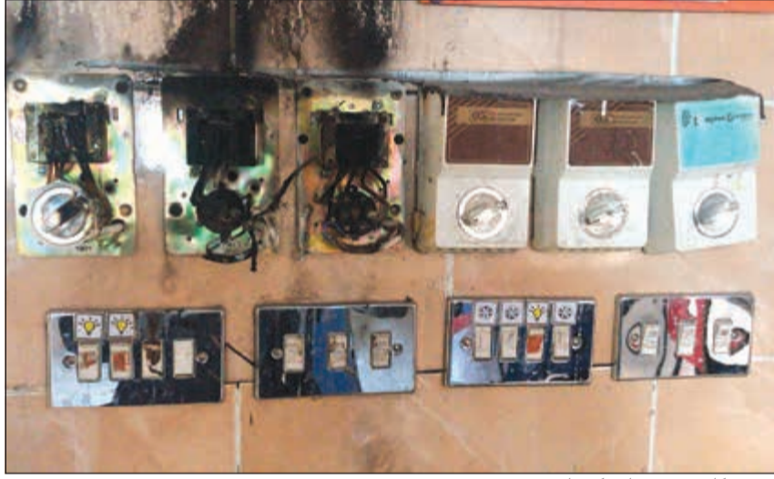
الحريق كان بسبب تماس كهربائي