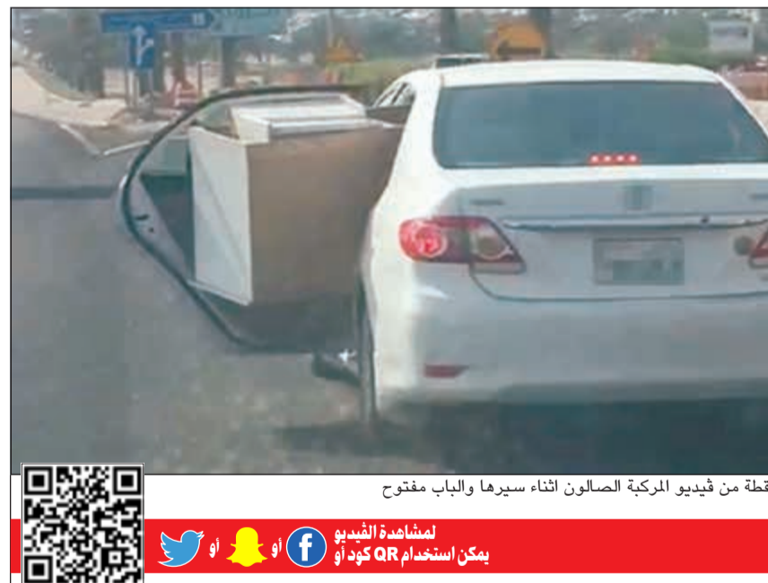
لقطة من فيديو المركبة الصالون اثناء سيرها والباب مفتوح

أحمد رجال الإطفاء حريقا محدودا اندلع في أحد مختبرات مدرسة الملا سعود الصقر الابتدائية للبنين بمنطقة العدان، ولم يؤثر الحادث على سير العملية التعليمية، وكان مركز عمليات الإطفاء قد