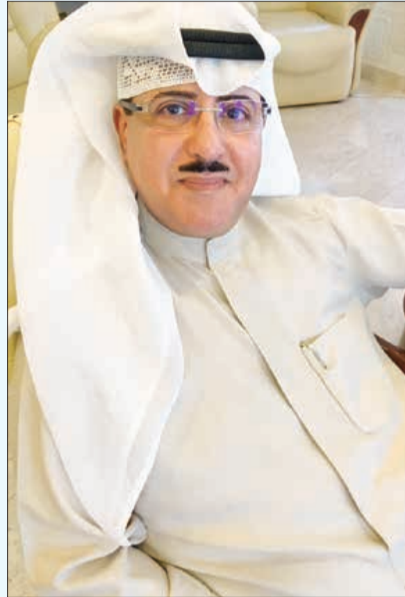
الوكيل المساعد لقطاع الإذاعة الشيخ فهد المبارك الصباح