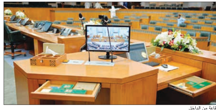
القاعة من الداخل