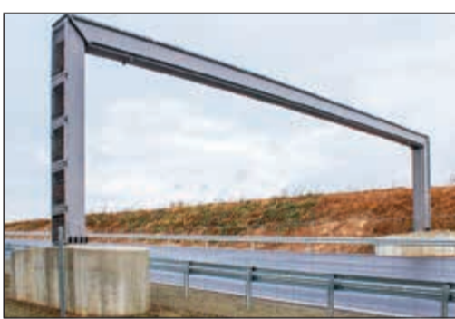
جسر الفئران الذي تم بناؤه في بلدة فيلهوفن

لا، لن أتزوج ثانية أبدا! عارضة الأزياء الأميركية - الصومالية المولدة إيمان باوي (63 سنة)، تؤكد أنها لن تدخل القفص الذهبي مرة أخرى بعد موت زوجها ديفيد باوي قبل 4 سنوات. وكشفت إيمان أن تزايد شعبية عارضتي الأزياء نعمي كامبل وسيدني كروفورد هو الذي دفعها لهجر عالم الأزياء عام 1988.