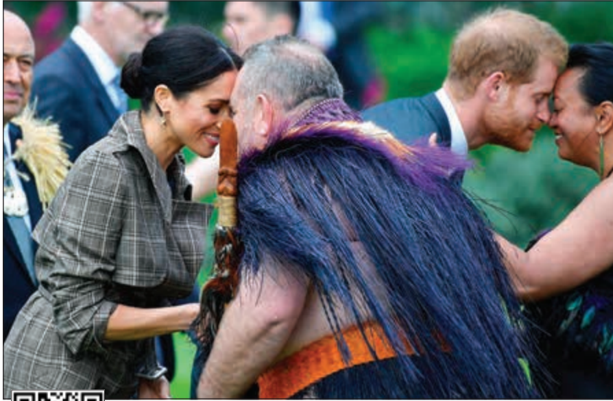
الأمير هاري وزوجته ميغان يتلقيان التحية التقليدية «هونغني» من زعماء الماوري سكان نيوزيلندا الأصليين

ولنغتون - رويتز: لقي الأمير البريطاني هاري وزوجته ميغان ترحيبا كبيرا لدى وصولهما إلى نيوزيلندا أمس في آخر محطات جولتهما في المحيط الهادي، وهي أول جولة ملكية دولية منذ زواجهما في مايو. واستقبلت رئيسة وزراء نيوزيلندا جاسيندا آرديرن الزوجين في مطار العاصمة ولنغتون وجرت مراسم الترحيب الرسمية في مروج مقر الحاكم العام للبلاد باتسي ريد. وحيا هاري وميغان زعماء الماوري، وهم السكان الأصليون لنيوزيلندا، بالتحية التقليدية التي تعرف باسم «هونغني» والتي تتلصق فيها أنوف الشخصين قبل أن يشاهدا رقصة «هاكا» وهي رقصة حربية قديمة عمرها قرون وأطلقت 21 طلقة للترحيب بهما.