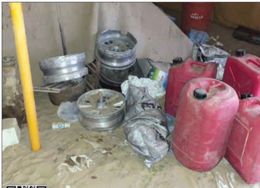
رنجات تالفة وجدت داخل مقر دار المستهترين