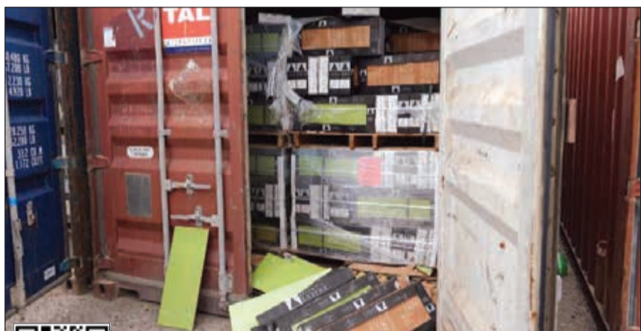
جانب من البضائع التي عرضتها «الجمارك» في مزاد الأربعاء الماضي