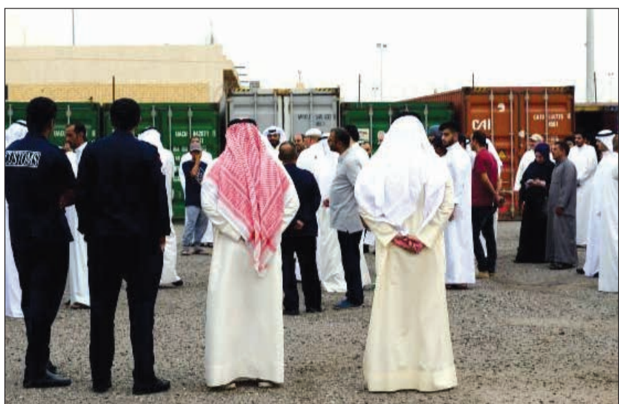
حضور لافت في المزاد

وطالبت الإدارة الراغبين في الشراء بالحضور إلى موقع المزاد ومراجعة عدة شروط في مقدمتها أن لجنة البيع بالمزاد لها حق بيع البضاعة صفقة واحدة أو عدة صفقات حسب ظروف البيع، ويحمل الراسي عليه المزاد عمولة دالة بواقع 2/2 من ثمن البيع، ويجب على الراسي عليه المزاد دفع قيمة البضاعة بموجب الدفع عن طريق الكي-نت K-net فقط، وفقاً لتقدير لجنة البيع بالمزاد. كذلك يتعين على الراسي عليه المزاد إخراج البضاعة من مقر مراقبة بيت المال بصورة عاجلة وخلال 5 أيام بعد رسو المزاد عليه، وإلا سيتم حجز أي بضاعة ويبيعها بالمزاد التالي إذا لم يقم من رسا عليه المزاد بإزالتها خلال المدة المحددة. ويحق للإدارة وقف البيع أو تأجيله أو إعادته في موعد آخر في حالة عدم الحصول على