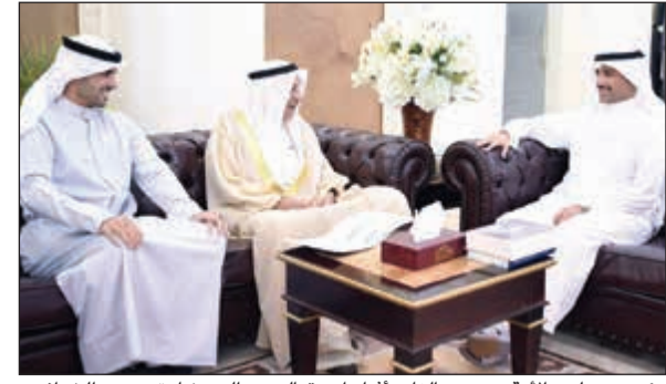
رئيس مجلس الأمة مرزوق الغانم أثناء استقباله عبدالله بشارة و بدر الخرافي

طالب النائب عمر الطبيبائي سمو رئيس مجلس الوزراء الشيخ جابر المبارك بإصلاح القطاع النفطي من «عرجه» وقياداته خاصة بعد بعض الأسماء المرشحة لشغل منصب الرئيس التنفيذي لمؤسسة البترول الذين كانوا سببًا في احراج سموه بوعود افتتاح مشروع الوقود البيني