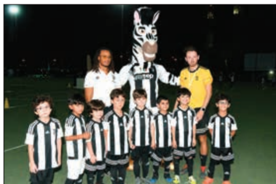
يشارك في إقلاق دوري أكاديميات يوفنتوس بجامعة الخليج