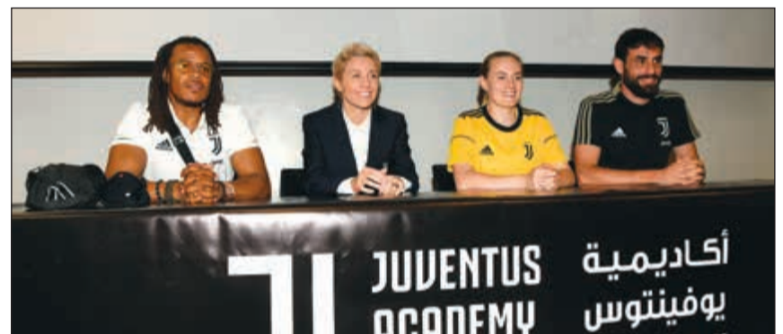
جانب من المؤتمر الصحافي للنجح العالمي إدغار ديفيدز (محمد هاشم)

المقدمة فهناك بافل ندفيد وزين الدين زيدان، وبارت كلويفرت وسيدورف ورنالدنيو، وتريزيغيه، كما كنت محظوظاً باللعب معهم، وأشعر بالفخر بتلك الفترة. من جهتها، رحبت المدير الفني لأكاديمية يوفنتوس الإيطالي هالا فارم بالنجم الهولندي، مشيدة بدعم الرعاة وجامعة الخليج لاهتمامهم الكبير بالأكاديمية، وأكدت بأنها وطول مدة إقامتها في الكويت الممتدة لثمانية أعوام فإن المشروع الرياضي المتمثل بأكاديمية يوفنتوس يتطور للمشاركة في العديد من المناسبات الرياضية لاسيما بطولة العالم لأكاديميات يوفنتوس 2019 الصيف المقبل، آملة المشاركة بباربعة فرق