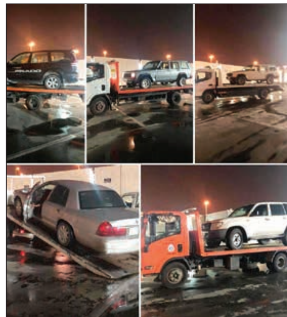
250 مخالفة مرورية تم تحريرها خلال الحملات

انتهت الإدارة العامة للجمارك من اجراء مزاد علني يوم الأربعاء الماضي قامت من خلاله ببيع 2600 كروز سجانر متنوعة، و159 طرد قطع غيار وبضاعة متنوعة، و800 طرد أمتعة شخصية، و(فله) بضاعة منوعة، وحاوية 20 قدما محتوياتها فحم وحاوية 20 قدما تحوي بلاط أرضيات وجران، وذلك في مقر مراقبة بيت المال التابعة للادارة الكائن في الصليبية على الدائري السادس، وقال رئيس لجنة بيع المزاد