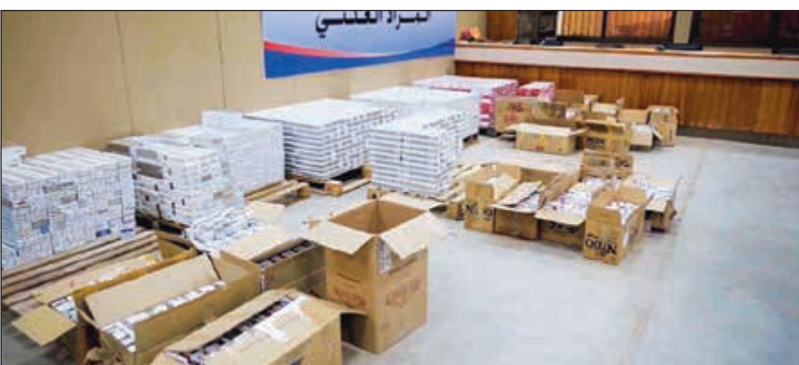
كروزات السجانر تم بيعها بالمزاد

العلمي في الإدارة العامة للجمارك على العنزي ان كافة المعروضات في المزاد تم بيعها بمبلغ 32750 دينارا كويتيا، لافتا إلى ان الإدارة العامة للجمارك نظمت المزاد وفقا للقوانين واللوائح المنظمة للسياسة الجمركية لبيع البضائع، حيث تم الاعلان عن موعد مزاد عبر الجريدة الرسمية (الكويت اليوم) والموقع الرسمي للجمارك ومواقع التواصل لإتاحة الفرصة لأكثر عدد من المشاركين، وأكد حرص لجنة المزاد بالجمارك بتقييم البضائع من جهة السعر بشكل تقريبي قبل تنظيم المزاد حفاظا على المال العام.