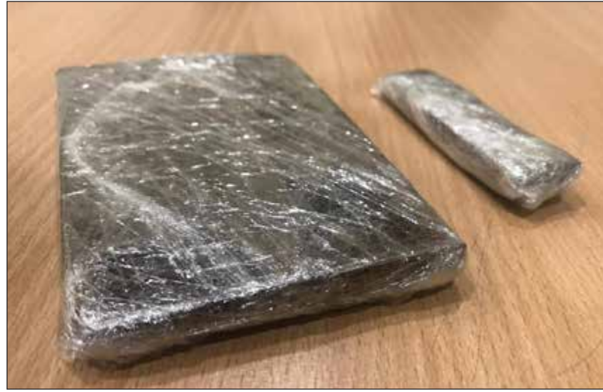
المضبوطات عبارة عن قطعة كبيرة من الحشيش وأخرى صغيرة