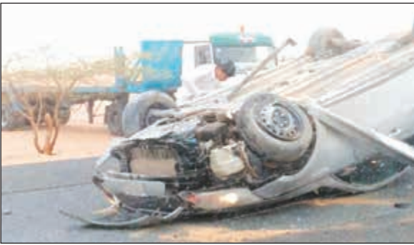
مركبة المواطن بعد انقلابها على «السالمي»

أسعف مواطن مواطن إلى مستشفى الجهراء بإصابات للعلاج من إصابات خطيرة لحقت به نتيجة انقلاب مركبته الصالون على طريق السالمي وفتح تحقيق في ملبسات الحادث. من جهة أخرى، أصيب سائق صهريج إثر حادث تصادم مع شاحنة على الطريق الدائري السادس. وتكررت إدارة العلاقات العامة والإعلام بالإدارة العامة للإطفاء، أن غرفة العمليات تلقت بلاغا بالحادث بعد منتصف ليلة أول من أمس فتم توجيه فرق إطفاء مراكز جليب الشيوخ والإسناد والمواد الخطرة بقيادة رئيس قسم