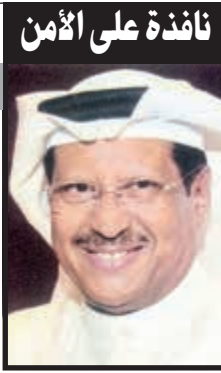
نافذة على الأمن

وطلب المتصل او النصاب من الفلبيني ان يعطيه رقم حسابه البنكي حتى يضع قيمة الجائزة فيه ويعدها طلب منه النصاب ويأبد جم أن يعطيه الرقم السري الخاص بحسابه، وحينما استجاب الفلبيني فوجئ بعدة رسائل تصله تباعا على هاتفه النقال تفيد بسحب كامل رصيده عبر عدة عمليات بنكية.