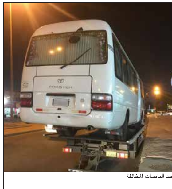
أحد الباصات المخالفة

نفذت ادارة العمليات بقطاع المرور اول من أمس حملة استهدفت الباصات والمركبات التي تستخدم في غير الأغراض المخصصة لها، وأسفرت عن تحرير 20 مخالفة وحجز 19 باصا لارتكاب مخالفة (تحميل ركاب بقصد الايجار بدون ترخيص)، جاءت الحملة في إطار جهود المؤسسة الأمنية لفرض هيبية القانون وضبط المخالفين والمستتهترين. وأكدت الإدارة العامة