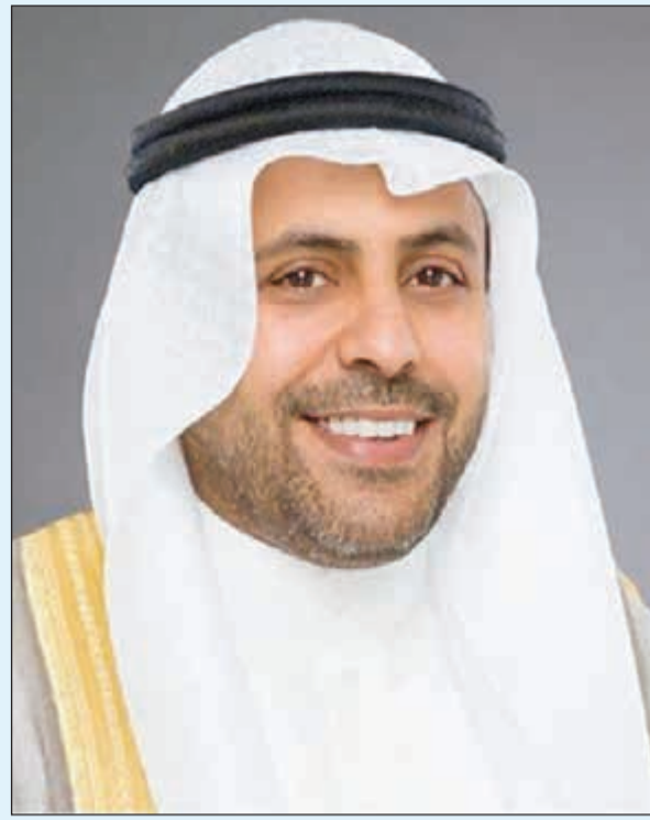
وزير الإعلام والشباب، محمد ناصر الجبري