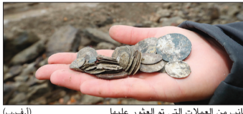
جانبي من العملات التي تم العثور عليها (أ.ف.ب)

ارد (المجر) - (أ.ف.ب): عثر علماء آثار على كنز من ألفي قطعة من الذهب والفضة في حطام سفينة في قعر نهر الدانوب تعود إلى القرن الثامن عشر، وذلك بعد انحسار منسوبه إلى مستوى لم يسبق له مثيل. وقال فريق الباحثين في متحف فرنسزي قرب بودابست لوكالة: «هناك ألفا قطعة نقدية وأسلحة وفتابيل ومدافع وسيوف وأسلحة أخرى». وعثر على هذا الكنز في ارد جنوب العاصمة حين كان العلماء يعملون على استخراج ما أمكن من قعر النهر قبل أن يرتفع منسوبه مجددا مع الأمطار، بحسب مراسل وكالة فرانس برس.