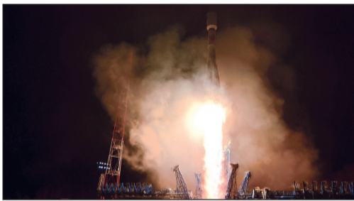
صاروخ «سويوز» لدى انطلاقه بالقمع الاصطناعي العسكري

موسكو - أ.ف.ب: أطلع أسس صاروخ روسي من طراز «سويوز» حاملا قمرا اصطناعيا إلى مدار الأرض، للمرة الأولى منذ تعطل صاروخ من الطراز نفسه لدى إقلاعه حاملا راندلين إلى الفضاء في 11 الجاري. وقال الجيش الروسي في بيان «أطلق صاروخ سويوز-2.1 بي حاملا قمرا عسكريا»، وهذه العملية هي الأولى منذ تعطل صاروخ من الطراز نفسه كان يحمل راندلين إلى محطة الفضاء الدولية في 11 الجاري اضطرهما للهبوط مجددا على الأرض.