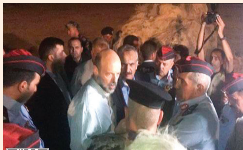
رئيس الوزراء الاردني عمر الرزاز في موقع السيول امس

يمكن استخدام QR كود أو لمشاركة الفيديو او او