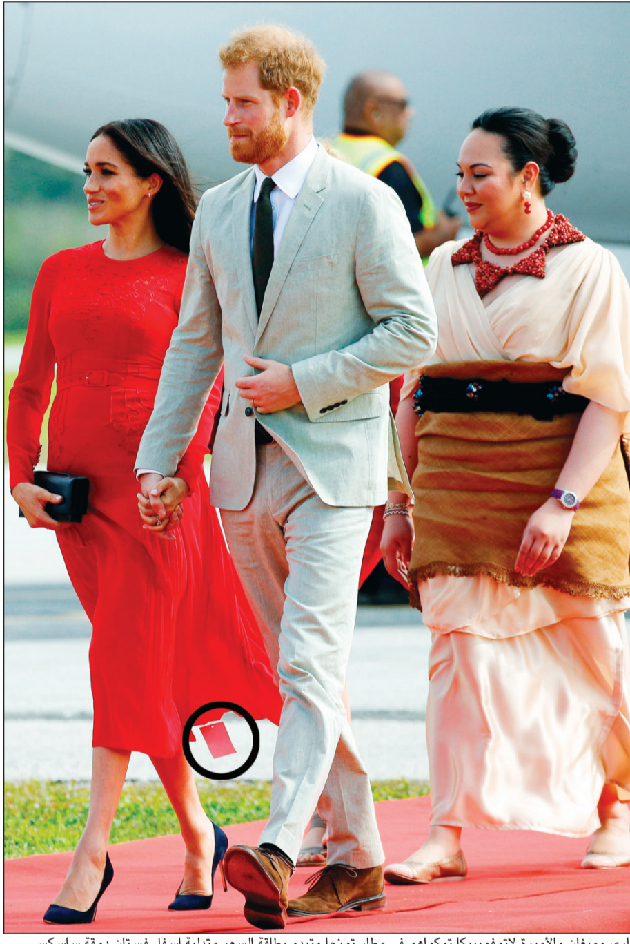
هاري وميغان والأميرة لاتوفوييكا توكواهو في مطار تونجا وتبدو بطاقة السعر متدلية أسفل فستان دوقة ساسكس

سيديني - (رويترز): رحبت أميرة من تونجا بالأمير البريطاني هاري، حفيد الملكة إليزابيث، وزوجته ميغان أمس الخميس لدى وصولهما إلى الدولة الصغيرة الواقعة بجنوب المحيط الهادي قبل أن يتوجها برا إلى العاصمة بينما حياهما آلاف التلاميذ ملوحين بالأعلام على طول الطريق. وصافحت الأميرة لاتوفوييكا توكواهو، الابنة الكبرى للملك الهندي، الأمير هاري وزوجته وانحنيت لهما. وكان هاري يرتدي بدلة من الكتان باللون البيج بينما ارتدت ميغان ثوبا أحمر طويل الكمين بلون علم تونجا. وقد لاحظ المصورون والصحافيون ان ميغان لم تنزع بطاقة السعر عن فستانها الجديد والتي بدت معلقة به بوضوح من الأسفل. وقد علقوا على ذلك قائلين ان ذلك يعد «زلة نادرة». وغنت راقصات يرتدين أثوابا ملونة ويضعن عقودا من الزهور الحمراء وريشا في شعورهن وصفقن للترحيب بالزوجين الملكيين في المملكة المؤلفة مما يصل إلى 170 جزيرة أغلبها غير مأهولة بالسكان. وتونجا هي الدولة الوحيدة ذات النظام الملكي الدستوري في منطقة أوقيانوسيا التي تحتفظ بعائلتها المالكة، بينما تعتبر دول أخرى تتبع النظام الملكي الدستوري مثل أستراليا ونيوزيلندا الملكة إليزابيث رئيسة لها.