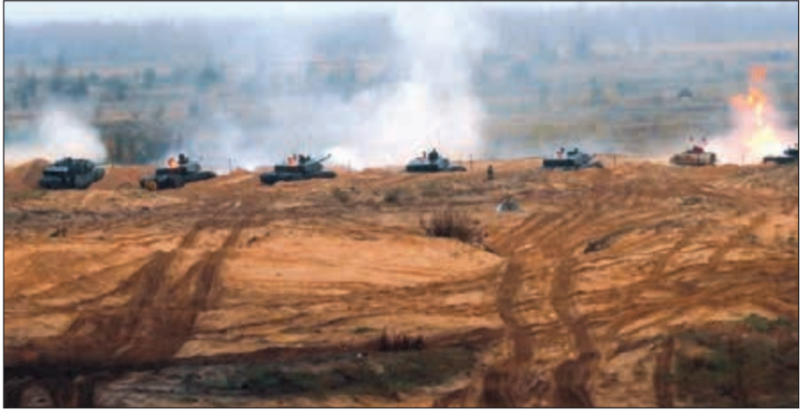
جانب من مناورات الناو الضخمة «الرمح الثلاثي» 48 في النرويج اسس

الروس واثنين من بيلاروسيا لمشاهدة المناورات، وقال ستولنتيرغ أنه يأمل أن «تجنّب روسيا السلوك الخطر». وفيما لم يتم تحديد «العدو المحتمل» رسمياً، فإن روسيا تتبادر إلى ذهن الجميع. وبتأهت روسيا، التي تتشارك مع النرويج بحدود بطول 198 كيلومتراً في الشمال الأقصى، بقوتها مراراً في السنوات الأخيرة. وقالت السفارة الروسية في أوسلو إنها تعتبر أن هذه المناورات «ضد روسيا».