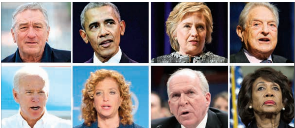
المستهدفون بالطرود المشبوهة: دي نيرو وأوباما وكلينتون وسوروس وبايدن وشولتز وبرينان وواترز

كان أعلن مؤخراً ان «منظمات يسارية من هندوراس مموله من قبل فنزويلا» تقف وراء قافلة المهاجرين هذه بعدما تحدث مع رئيس هندوراس خوان اورلاندو هرنانديز. ووصل هؤلاء الأشخاص البالغ عددهم نحو سبعة آلاف شخص إلى ماباستيك المدينة الواقعة على بعد أكثر من 100 كلم عن الحدود المكسيكية - الغواتيمالية التي دخلوها بالقوة في 19 الجاري، وقالوا إنه لا يزال أمامهم 45 يوماً لبلوغ الولايات المتحدة. في غضون ذلك، رد الرئيس الفنزويلي نيكولاس مادورو بقوة على نائب الرئيس الأميركي مايك بنس الذي