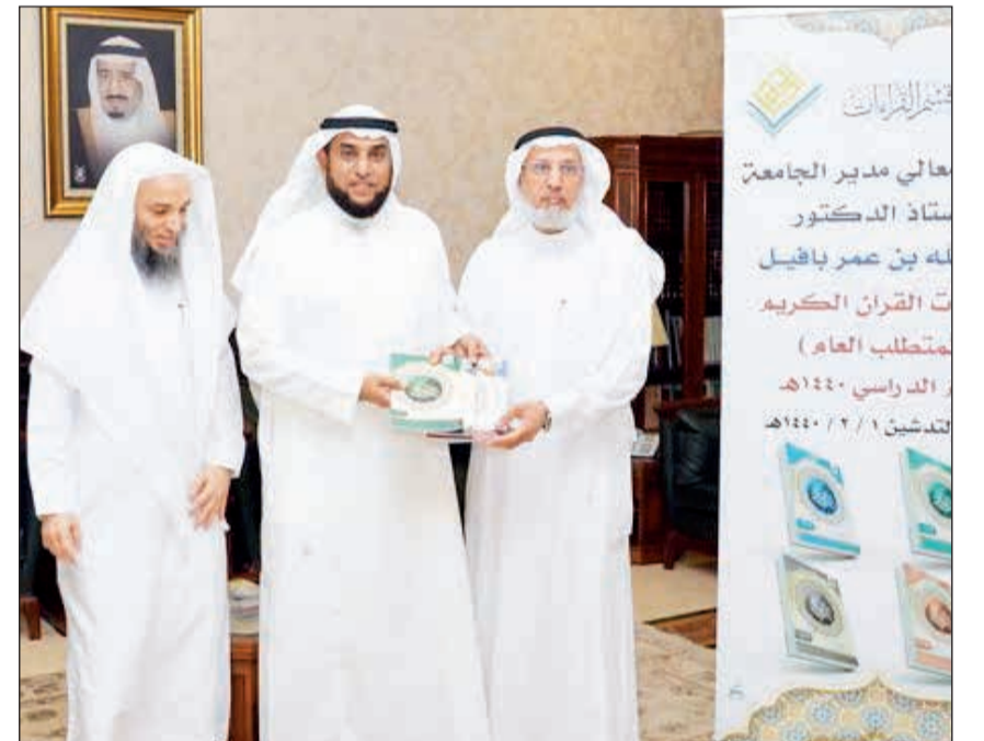
مدير جامعة أم القرى وإمام الحرم المكي يبدشن مقررات القرآن الكريم