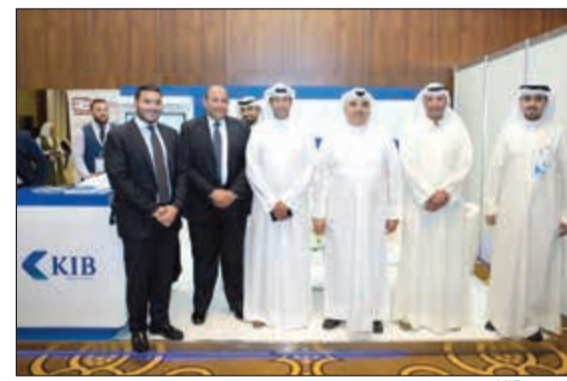
ممثلو «KIB» في جناح البنك