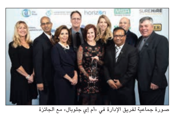
صورة جماعية لفريق الإدارة في «أم إي جلوبال» مع الجائزة

توجت شركة أم إي جلوبال كندا، شركة تابعة بالكامل لشركة إيكويت للبتروكيماويات، الجهة العالمية الرائدة في إنتاج وصناعة البتروكيماويات، في 18 أكتوبر الجاري، بجائزة «المستوى الذهبي» في حفل أقيم في المدينة الكندية تورتو، لتوزيع الجوائز على الشركات الأكثر حرصاً على شؤون السلامة في كندا، وتعد هذه الخطوة إنجازاً جديداً يضاف إلى سجلات تاريخ شركة أم إي جلوبال والتي تحتوي على العديد من الإنجازات التي استطاعت الشركة تحقيقها في غضون فترة زمنية قصيرة.