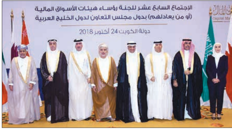
لقطة جماعية لرؤساء هيئات الأسواق المالية بدول مجلس التعاون الخليجي (احمد علي)