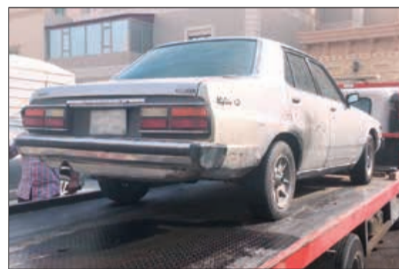
مركبة مخالفة في طريقها إلى الحجز