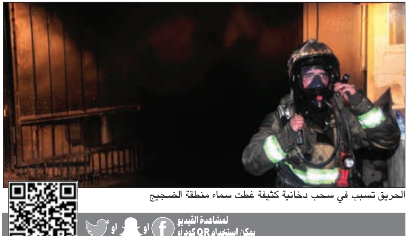
الحريق تسبب في سحب دخانية كثيفة غطت سماء منطقة الضجيج