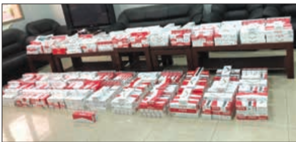
السجانر التي تم إحباط محاولة تهريبها

في ساحة تفتيش المركبات بعد أن ظهرت علامات الارتباك على المغادر فتم تفتيش المركبة بدقة وبأجهزة متقدمة، فعثر على 642 كروزر سجانر مخبأة بطريقة سرية في سيارته ذات الدفع الرباعي.