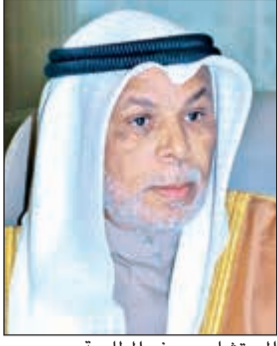
المستشار يوسف المطوعة

العقوبة وفق المادتين 81 و82 من قانون الجزاء، مشيرة إلى أن هذا النص أهدر بذلك جوهر الوظيفة القضائية بشأن الجريمة محل الدعوى الجنائية بحرمات القاضي من تقدير العقوبة التي تناسبها. وأضافت المحكمة أن النص المطعون عليه أهدر ضوابط المحاكمة المنصفة للمتهم في مجال فرض العقوبة كما يمثل تدخلا محظورا من السلطة التشريعية بشؤون القضاء واستقلاله، ما يمس ذلك النص بعيب مخالفة لأحكام المواد 34 و50 و163 من الدستور.