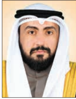
الشيخ د.باسل الصباح

المواضيع الأمن الصحي بدول المجلس عبر تطبيق المنظومة الخليجية لفحص العمالة الوافدة والإجراءات الصحية الموحدة في المنافذ الحدودية ضمن إطار اللوائح الصحية والمخزون الاستراتيجي من الأدوية والامصال والمستلزمات الطبية أثناء الطوارئ. وأشار إلى ان الاجتماع سيناقش البطاقة الصحية