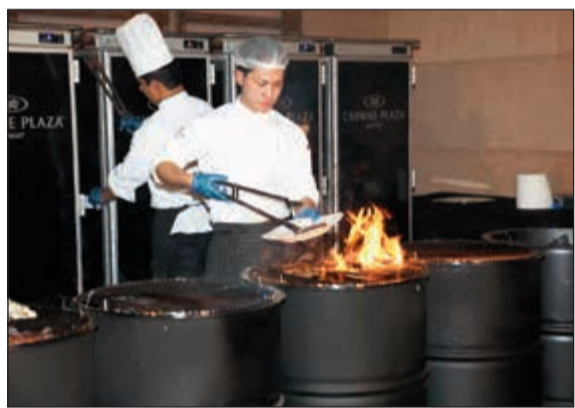
أطباق تعكس ثقافة المطبخ الشرقي والعالمي

من أن كل ضيف يستمتع بأمنية استثنائية مليئة بالمتعة لا تنسى. والثريا سيستي وجهة للمطاعم المميزة والمكان المناسب لجميع أفراد العائلة والأصدقاء لتناول وجبة في أي من مطاعم العشرة، حيث يتاح للضيوف فرصة الاستمتاع بخيارات عديدة من المأكولات المحلية والعالمية الفاخرة بطرق مبتكرة وعصرية.