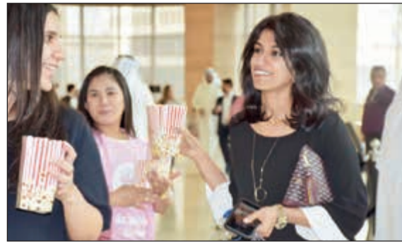
مشروبات وعصائر صحية خلال الفعالية