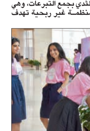
فعاليات مختلفة في الكرنفال