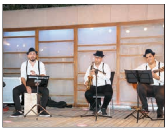
أجواء ساحرة على أنغام الموسيقى