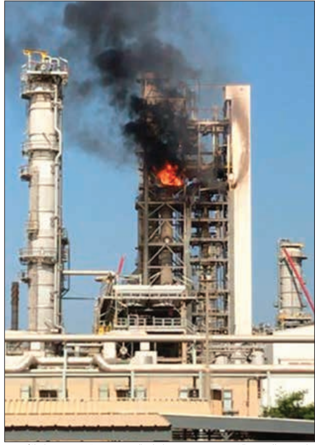
جانب من الحريق الذي حدث في وحدة إنتاج البنزين رقم 25 في مصفاة الأحمدي شهر مايو الماضي