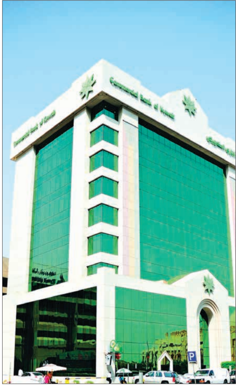
مبنى البنك التجاري

المعاملات والتواصل مع البنك بسهولة، مشيراً إلى المبادرات الجديدة التي أطلقها البنك مؤخراً ومنها خدمة الدردشة الإلكترونية Live Chat، والتي تتيح للعملاء التحدث المباشر صوتياً أو عن طريق الفيديو مع موظف البنك التجاري عبر تطبيق «التجاري موبايل» للهواتف الذكية وهذه الخدمة تمكن العملاء من إتمام العديد من المعاملات المصرفية والرد على استفساراتهم بمنتهى السرعة، بالإضافة إلى تفعيل أو إيقاف البطاقات والخدمات المصرفية وكذلك العديد من الخدمات المصرفية الأخرى المتاحة عبر تطبيق البنك على الهواتف الذكية مثل تحديث البيانات الشخصية على النظام، وهو ما يجعل العملاء على اتصال بالبنك دون الحاجة إلى زيارة أي من فروع البنك، إلى جانب تقييم المخافة بعد الانتهاء من الاتصال، فضلا عن الخدمات الأخرى التي وفرها البنك للعملاء من أجل إتمام وإنجاز العديد من المهام «أون لاين» من خلال تطبيق التجاري موبايل دون الحاجة لزيارة أي فرع من فروع البنك، مثل تحديث بيانات البطاقة المدنية وإمكانية تفعيل بطاقاتهم المصرفية (بطاقات الخصم والإئتمان) قبل السفر، وخدمة الدفع الفوري بتقنية التواصل قريب المدى NFC بشأن المدفوعات التي تتم باستخدام بطاقات الخصم (الخدمة اللائحة) وخدمة إنشاء وتفعيل المستخدمين بالإضافة إلى ذلك، يستطيع العملاء الدخول على حساباتهم باستخدام خاصية بصمة الوجه المتاحة على أجهزة الآيفون.