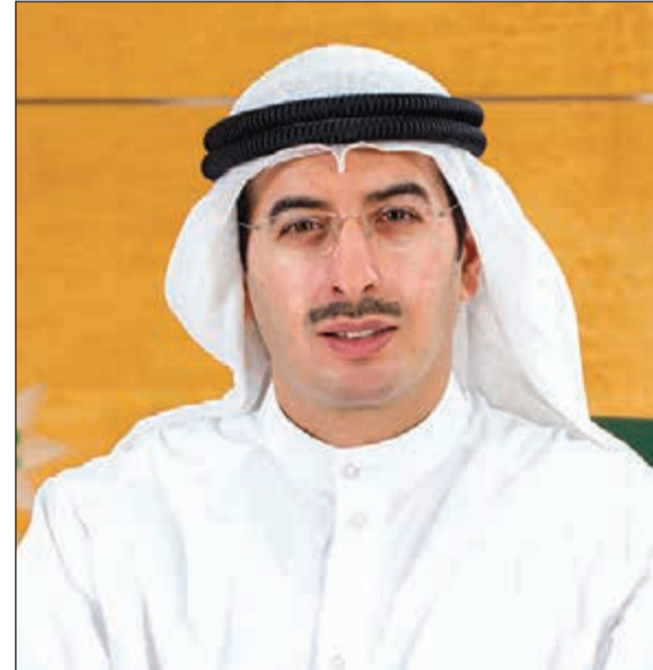
الشيخ أحمد الصباح

الاستثمار بالتكنولوجيا من جانب آخر، أكد الشيخ أحمد الصباح البنك يواصل جهوده نحو الاستثمار في النظم التكنولوجية الحديثة ورأسماله البشري لتلبية احتياجات وتوقعات العملاء عن طريق تزويدهم بخدمات مصرفية متطورة ومبتكرة تمكنهم من إجراء العديد من المعاملات بلحمة واحدة، فضلا عن تيسير إجراءات