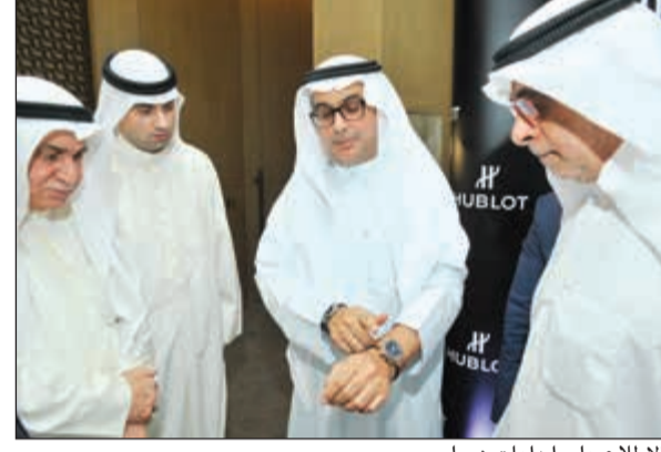
الإطلاع على إبداعات هوبلو