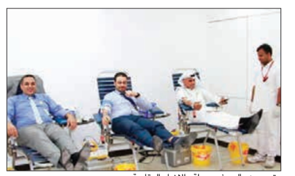
متبرعون بالدم في حملة «الإنماء العقارية»

وأضاف أن الحملة تأتي امتداداً للحملات السابقة التي حققت نجاحاً، لافتاً إلى استقطاب أعداد كبيرة من المتبرعين، إذ شهدت إقبالاً واسعاً من موظفي الشركة والشركات المجاورة والزائرين على التبرع بالدم، مشيراً إلى أن شركة الإنماء العقارية قامت بتجهيز قاعة بالمقر الرئيسي للحملة لإقامة الحملة به وتمت تهيئته بشكل كامل لاستقبال المتبرعين مما ساهم في نجاح الحملة. كما أعرب عن خالص شكره وتقديره للمساهمين في هذه الحملة التوعوية والذين تبرعوا بالدم لمساعدة المرضى المحتاجين.