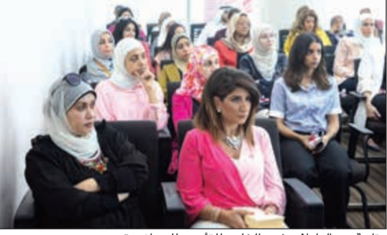
متابعة من العاملات في «الخليج للتأمين» للمحاضرة