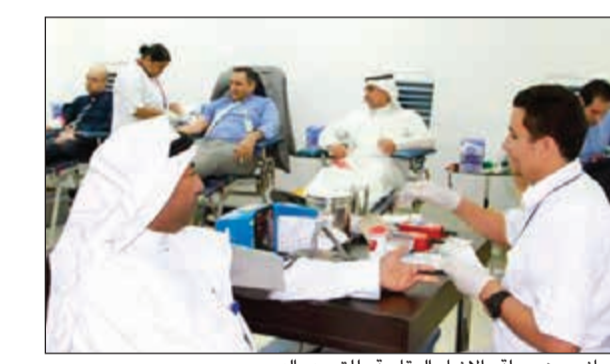
جانب من حملة «الإنماء العقارية» للتبرع بالدم