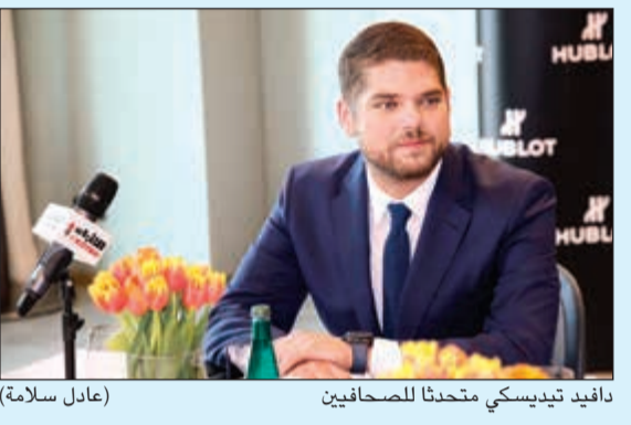
دافيد تيديسي يتحدث للصحافيين (عادل سلامة)

الإقليمي المتوقع والتطورات المستقبلية وما يطمح إليه بعد توليه مهام الإدارة في الشرق الأوسط، مشيراً إلى أن شعار هوبلو الذي يرفعه هو «الأولى، المختلفة، والفريدة» سيكون نبراساً له للعمل على تحقيق إضافات مهمة لهذا الاسم الكبير. وتحدث عن سعي لتطوير علاقة هوبلو مع عملائها لتكون أقرب لهم عبر وسائل التواصل الاجتماعي، مؤكداً أن الساعات الذكية لن تشكل خطراً على الساعات الكلاسيكية فحتى الشباب سيمولون رويدا رويدا وسيرغبون فيما بعد في ساعات كلاسيكية.