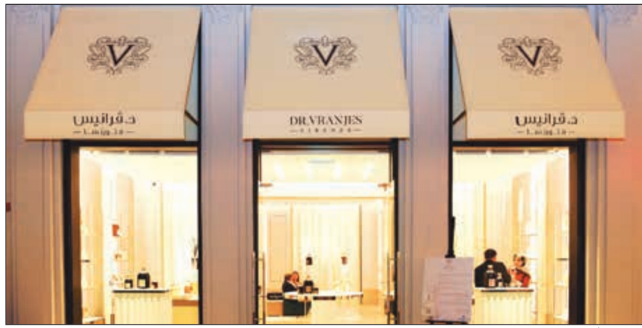
علامة د.فرانسيس الإيطالية في «الافنيوز»