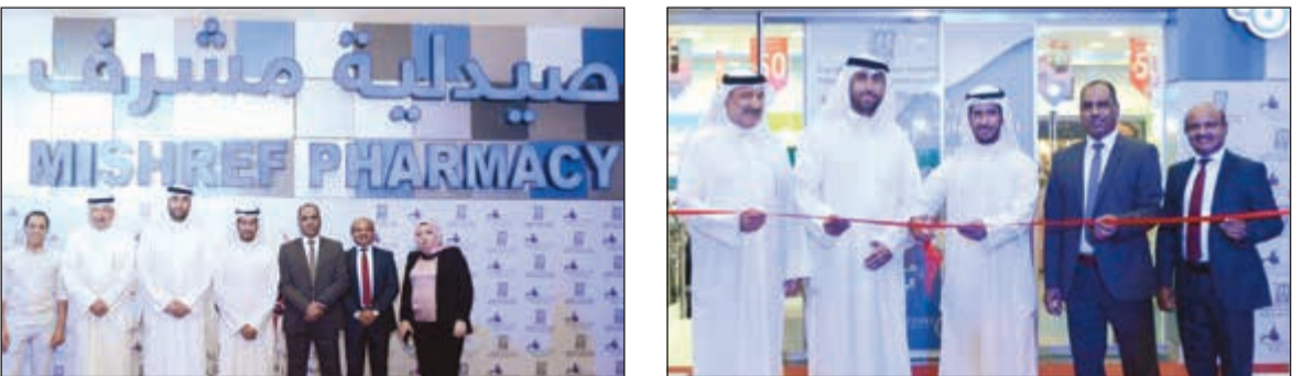
لقطة تذكارية خلال مهرجان صيدلية مشرف

على مدار العام ومن خلال التنوع السلعي وذلك من أجل الارتقاء بالمستوى التسويقي والخدمات التي يقدمها للمساهمين وأبناء المنطقة بالمقام الأول، كما يؤكد مجلس الإدارة أن جمعية مشرف التعاونية ستدعي عنوان التميز في المهرجانات التسويقية. وتحضر جمعية مشرف التعاونية على اختيار الشركات المشاركة بمهرجان الصحة والجمال بصيدلية مشرف وهم شركاء نجاح معنا وتترامح الشركات من أجل المشاركة بالمهرجان تصادقية الجمعية مع المساهمين والمتسوقين والموردين، وهذا يعبر عن أسرار نجاح المهرجانات بجمعية مشرف التعاونية، عدد الشركات المشاركة